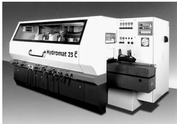
Novi Weinig Hydromat 23 C

Tudi standardni rezkalni avtomat Profimat 23 E bo v Milanu predstavljen z delovno širino do 260 mm s petimi