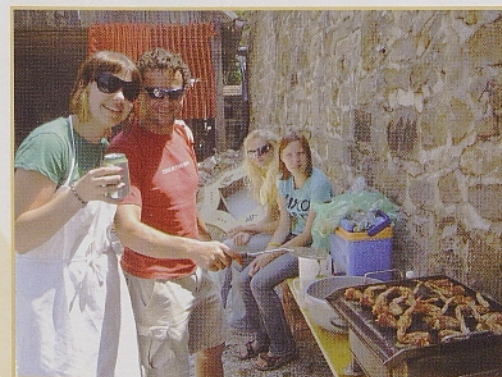
Na ostalih slikah: utrinki z Drage mladih 2007