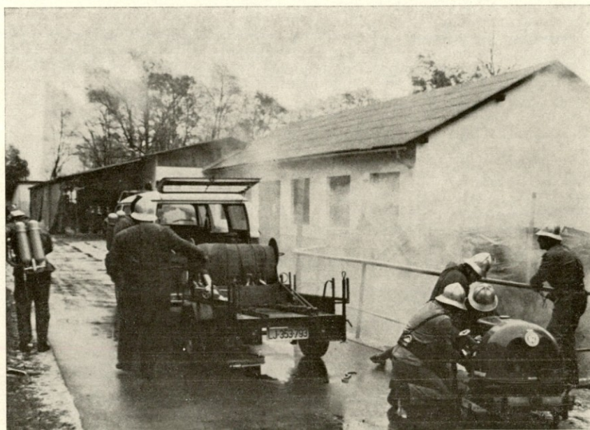
Samo dobra pripravljenost gasilcev brez motorne črpalke bi bila premalo za uspešno pogasitev požara

Ob dnevu republike, prazniku naše federativne skupnosti, čestitamo vsem sedanjim in upokojenim sodelavkam in sodelavcem.