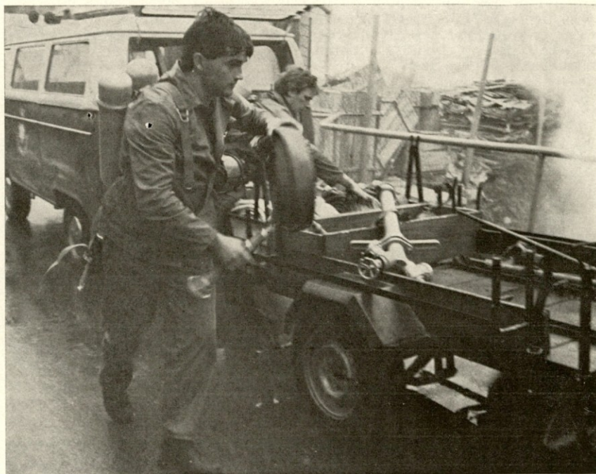
Pri požarih se poleg vročine razvijajo tudi strupeni plini (CO) pred katerimi se gasilec uspešno zaščiti le z izolirnim dihalnim aparatom

V okviru meseca požarne varnosti so člani-ce IGD INDUPLATI Jarše in pripadniki enote CZ izvedli praktično gasilsko vajo na obrat naše tkalnice. Vaja je bila izvedena na dane pogoje hitro in pravilno. Pri vaji je bilo opaziti, da želi vsak sodelujoči pokazati vse tisto, kar se od gasilca-reševalca pričakuje t.j. hitrost, pravilnost spajanja gasilskih cevi, hiter odvzem vode in pravilen pristop pri gašenju požara. Po končani vaji so se zbrali v gasilskem orodišču, kjer so na dokaj kritičen način analizirali izvedeno vajo. Med sodelujočimi je bilo opaziti, da znajo pošteno kritiko sprejeti in napake v zvezi s kritiko odpraviti. Izražena je bila tudi želja po večjem številu praktičnih gasilskih vaj, kajti le na ta način se da doseči ustrezno pripravljenost za primer izbruha resničnega požara.