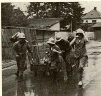
V akcijo gašenja požara so se zelo uspešno vključile tudi dekleta članice IGD INDUPLATI — Jarše