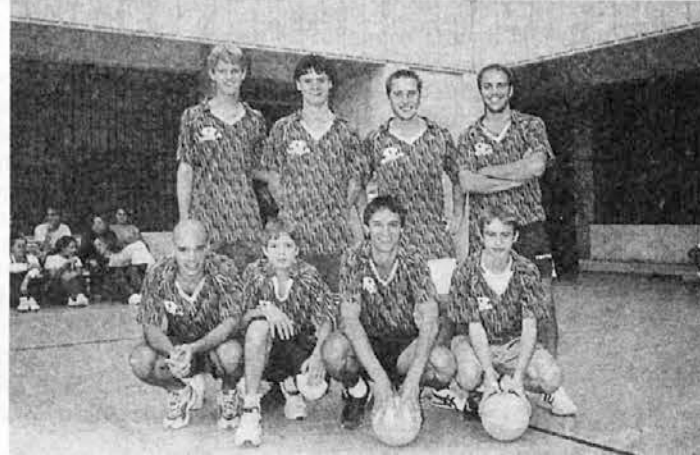
Fantje iz Slovenske vasi