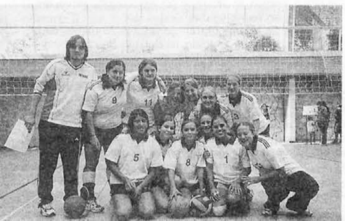
Dekleta iz San Martina