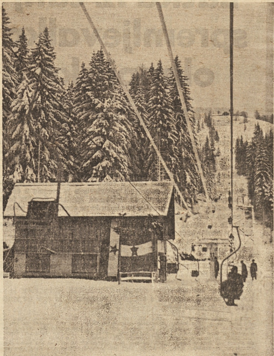
Nova sedežnica na Španov vrh že obratuje

Ko govorimo o gradnji nove sedežnice, moramo posebej poudariti osnovno misel, ki je vodila investitorje pri konstruiranju te sedežnice. Investitorji so mislili na rekreacijski in turistični pomen te žičnice, saj so se Jeseničani že od nekdaj radi oddaljevali od zadimljenega mesta in hiteli v bližnjo okolico, v lepo planinsko okolje. Prav ta objekt bo odslej dalje omogočal, da se bodo domačini, naši in tuji turisti v najkraj-