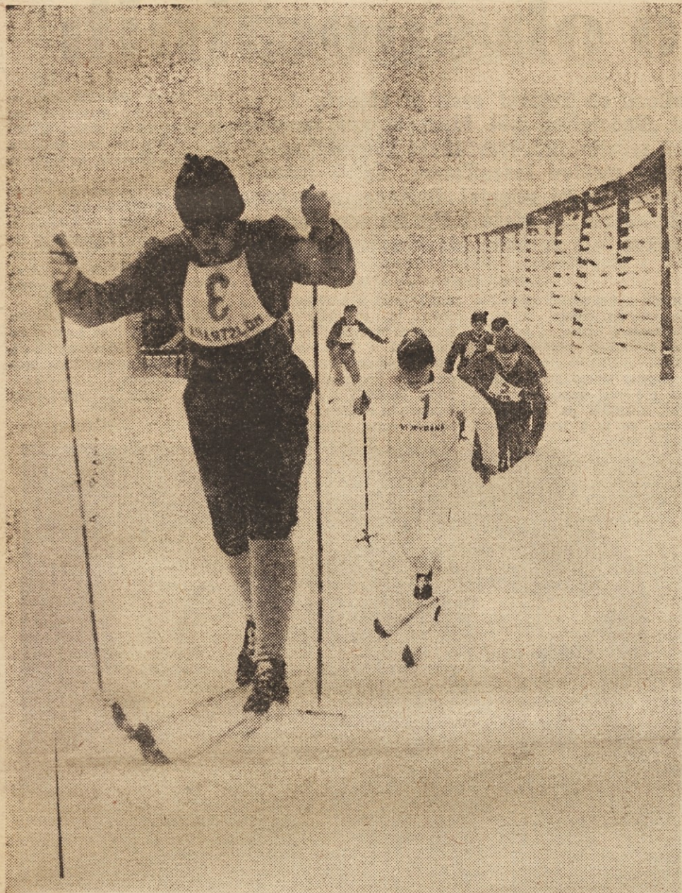
Današnje tekme v Mojstrani so bile v izredno težkih pogojih, po globokem snegu in snežnem meteu.