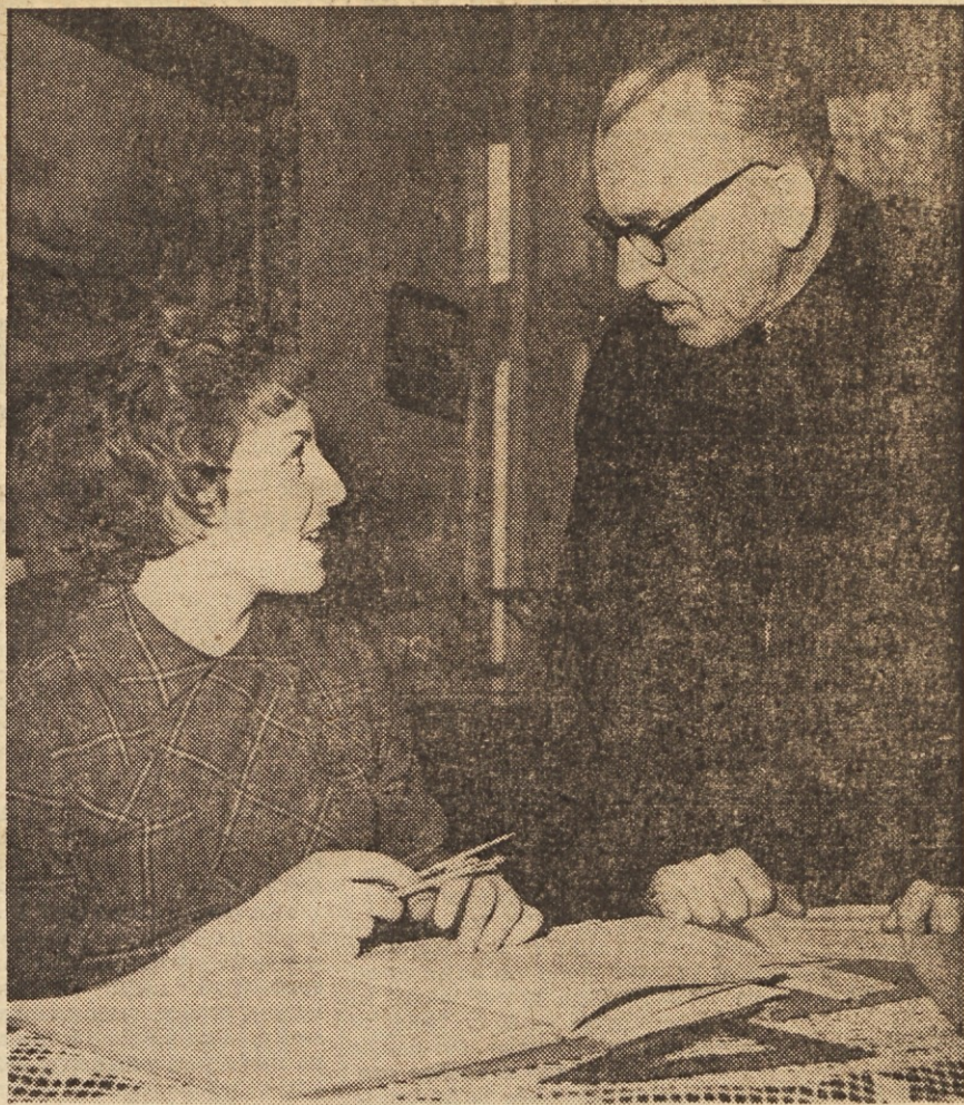
Razen treninga je bilo treba najti tudi čas za večerno gimnazijo. Najvestnejši pomočnik pri učenju je bil njen oče

Vse telovadne elemente zna združiti v en sam nepozaben film. Videl sem jo pri obveznih vajah in moral sem spet priti na proste vaje. Danes lahko rečem, da je bil to eden mojih največjih doživetij olimpijskih iger v Tokiu. Vero Časlavsko poznamo bolj kot kdorkoli drug, saj je vsak dan srečamo, spremljamo njene treninge, pa vendar smo se vprašali z istimi besedami kot A. Hary: Le od kod ima toliko poguma?