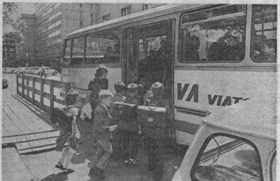
PA SE EN MOTIV IZ OSNOVNE ŠOLE MAJDE VRHOVNIK. Razred, ki se vsak dan vozi v šolo in iz šole domov, vstopa v avtobus.