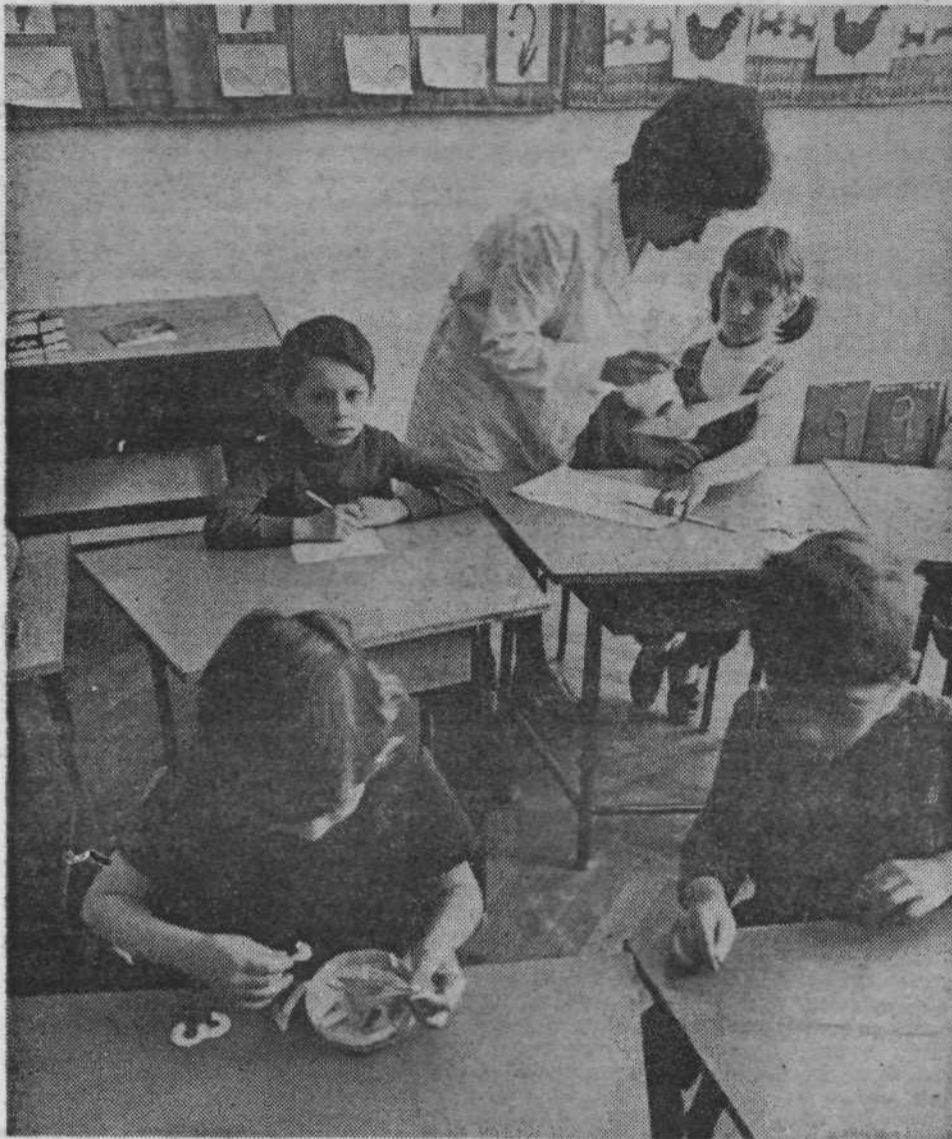
POSEBNA OSNOVNA ŠOLA. Na sliki je oddelek na Levstikovem trgu.