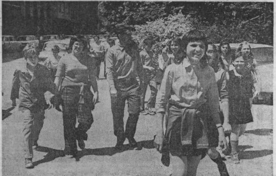
OSNOVNA ŠOLA MAJDE VRHOVNIK. Telovadba je za zdaj še v Tivoliju.