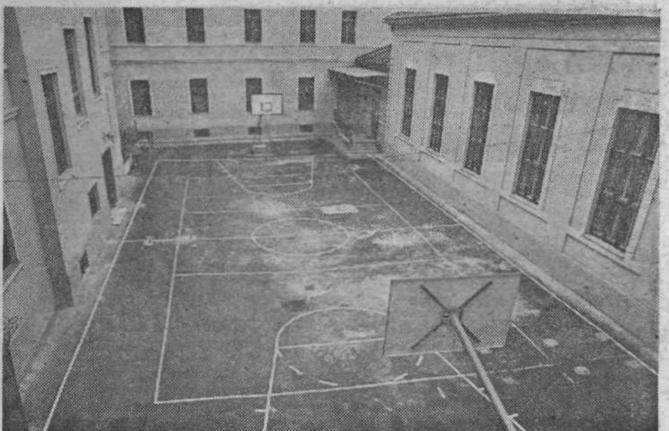
NA POLJANSKI GIMNAZIJI so se znašli. Ko so jim vzeli igrišče, so na neuporabljenem dvorišču uredili prostor za košarko in odbojko.