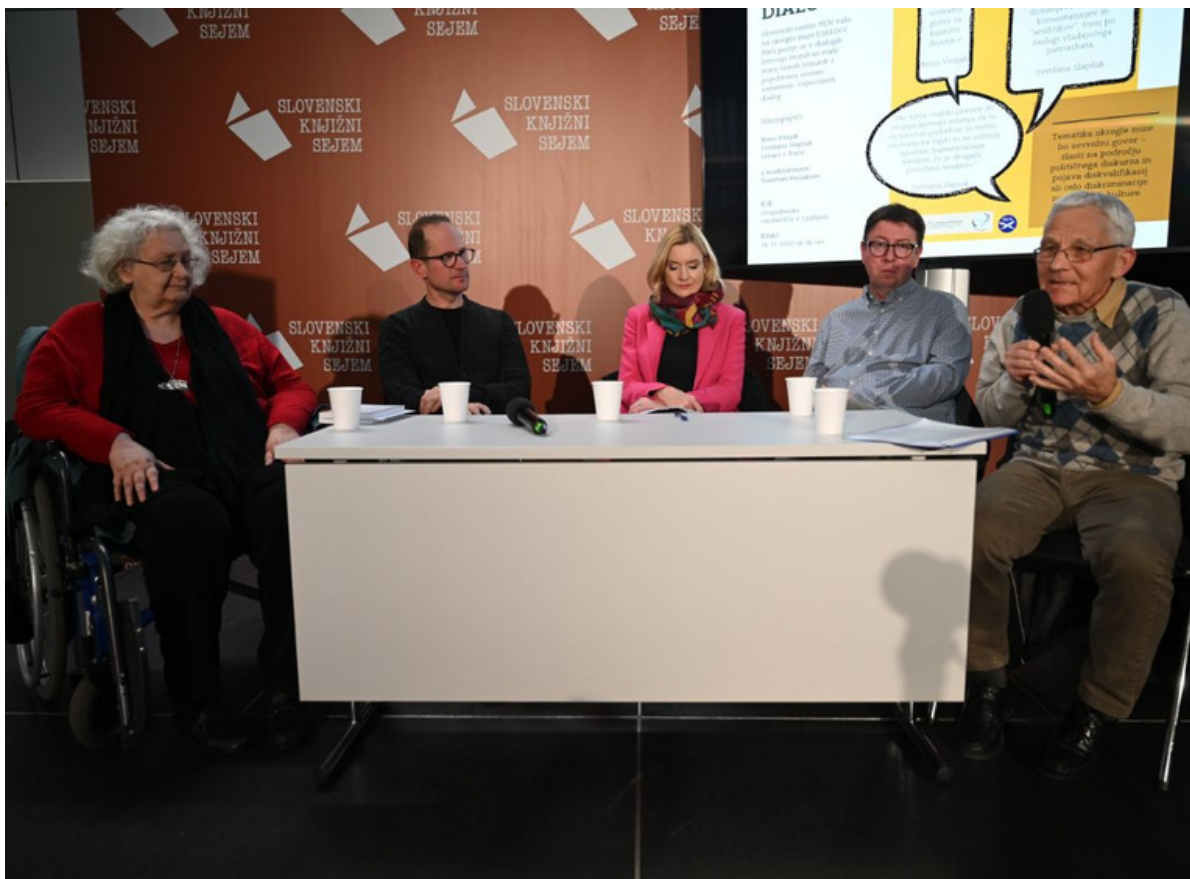
Foto: okrogla miza DIALOGI, SKS 2022

Osnovno poslanstvo in namen Mednarodnega Pen-a in vsakega posameznega centra izhaja iz Temeljne listine Mednarodnega Pen-a. Gre za uresničevanje načela, da književnost ne pozna meja, in da teh meja tudi ne bi smel nihče zahtevati ali na njih postavljati ograj, naj bo med državami ali literaturami, naj bo znotraj posamezne države ali nacije. To seveda enako velja za jezike in, kot iz tega sledi, za svobodo izražanja kot civilizacijski standard. Vse ostalo, kar Pen še razglša, zagovarja in promovira, v bistvu izhaja iz tega, vključno s svobodo izražanja za ženske, pisateljice ali pesnice ali esejistke, kar je seveda, žal, res še marsikje po svetu neposredno ali vsaj posredno omejeno ali celo prepovedano. V tem kontekstu je seveda cilj Pen-a tudi političen, če mislimo politiko najširše kot urejanje javnih zadev in zagotavljanje vseh deklariranih človekovih pravic in svoboščin, ki jih je ravno tako sprejela politika v okviru OZN in sorodnih povezav ali organizacij na nižjih ravneh.