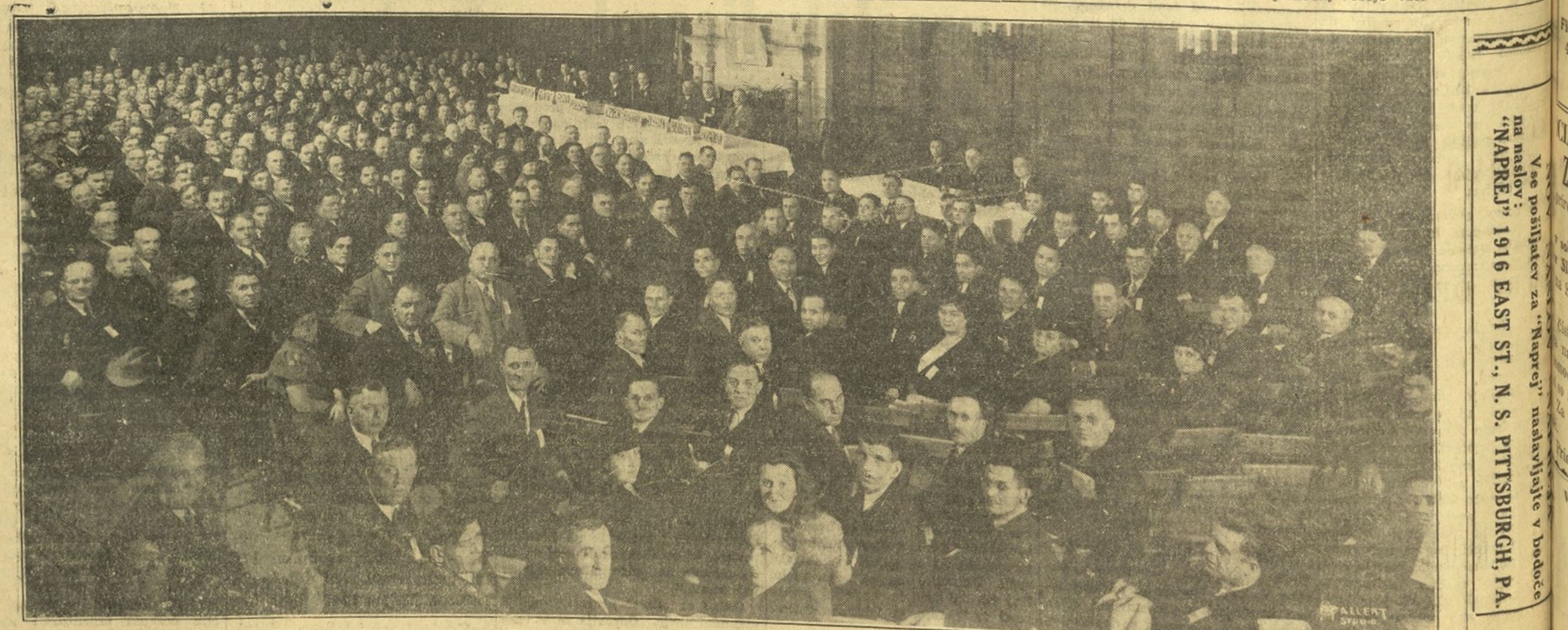
Posnetek iz zasedanja Vseslovanskega kongresa, ki se je vršil 3. decembra v Pittsburghu, Pa. — Slovenci sedijo ob desni strani predsedniške mize.

Zapisnik in rezolucije kongresa v Pittsburghu bodo tiskani v 2000 izvodih, ter dostavljeni delegatom in organizacijam, ki so bile na kongresu in tudi onim izven Pennsylvanije, ki bodo povaljene na prihodnji