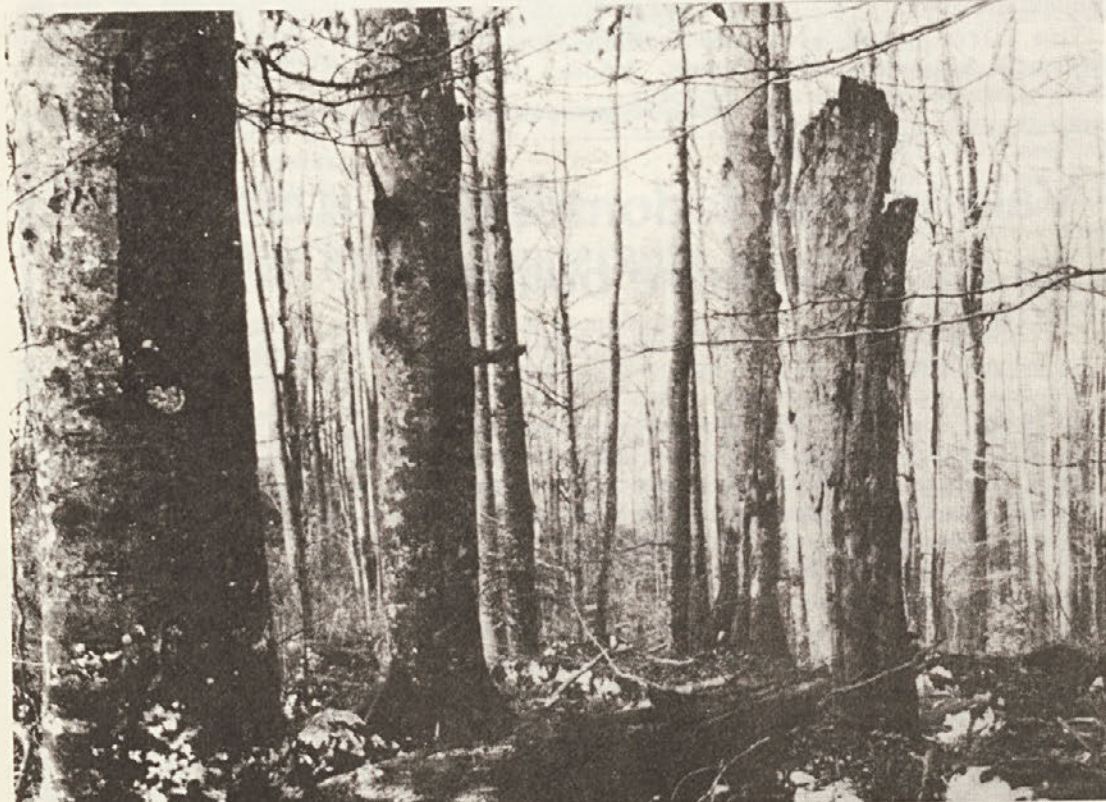
Takih starih mam (bukev je mati gozda!) je tudi na Palatini vse manj. Zaradi poškodb ob požaru, ki so ga zanetili okupatorji med drugo svetovno vojno, se sušijo in propadajo.

Kako tragične razmere je zavzela prometna (ne) varnost na naših cestah, lahko razberemo tudi iz novoletne poslanice predsednika Tita: opozoril je na ljudske žrtve v prometu, ko bi si vsi morali kar najbolj prizadevati za človeka, našo največjo dragocenost!