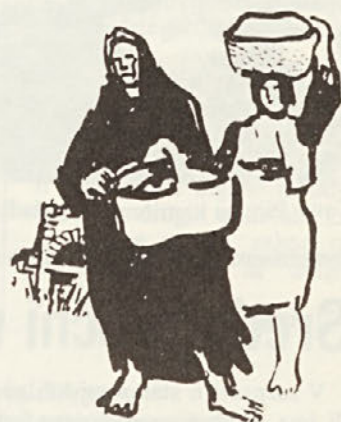
Ive Šubic: Priboljšek