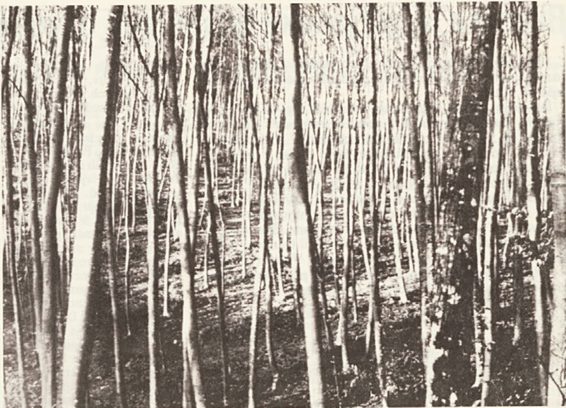
Temu bukovemu letjenjaku na Ljubnu se dobro pozna skrbno delo gozdarjev. O redčenju imamo vse več izkušenj in marsikje že lahko opazimo, kako močno so se izboljšali bukovi sestoji.

V Romuniji po posebnem postopku kompostirajo bukovo žaganje v posebnih jamah v drevesnicah. Analize kažejo, da je kompost primeren za gnojenje drevesnic, ker les razpade na ustrezne elemente. Stroški za jame so majhni in se hitro amortizirajo.