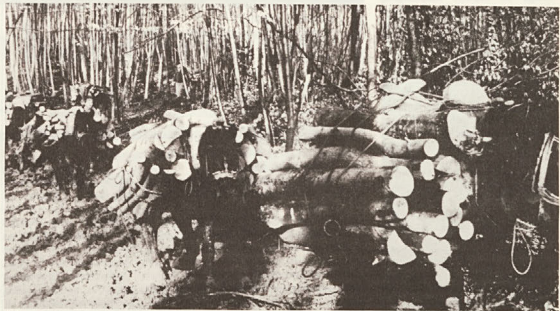
Vrsta težko otovorjenih bosanskih konj (Ljuben 78).