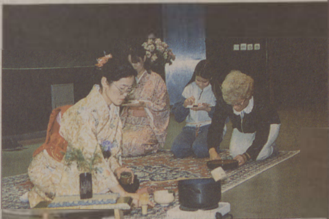
Priprava in pitje čaja - približevanje delčka japonske kulture

»Ločitev odobravam samo v primeru, če je situacija v zakonu nevzdržna, če je nasilje, alkohol – Ločitve zaradi različnosti interesov ali karakterja pa ne priznavam. Menim, da je v zakonu ta različnost celo pozitivna, prek nje se spoznavamo, dopolnjujemo in bogatimo.«