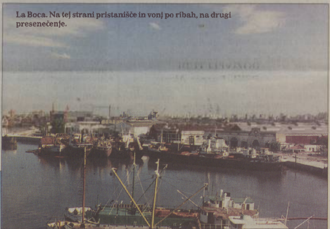
La Boca. Na tej strani pristanišče in vonj po ribah, na drugi presenečenje.

V mestu je ogromno stavb sumljivega izvora. Dostikrat se zdi, da so kopije evropskih ali severnoameriških zgradb. Srebrni stolpič z uro je že tak primerek.