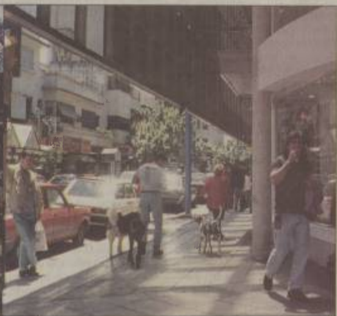
Biti sprehajalec psov je v Argentini dobro plačan poklic. Obvladovati morajo tudi do petnajst štirinožcev, ko si ti zaželijo sprehoda, njihovi lastniki pa jim nimajo časa delati družbe.