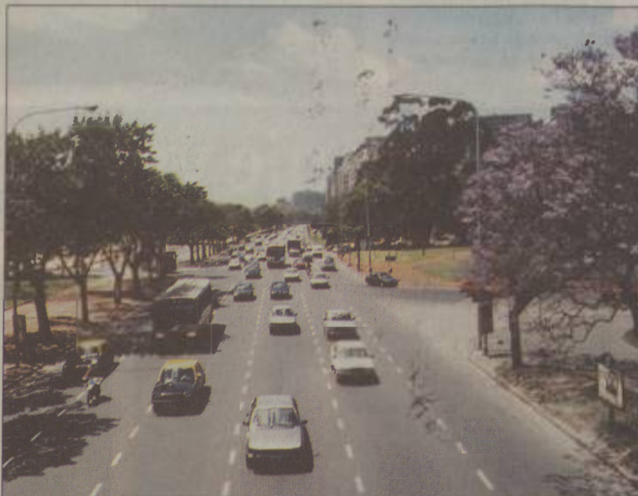
Prihod v Buenos Aires me je presenetil s pogledom na ogromne zelene površine in široke avenije.