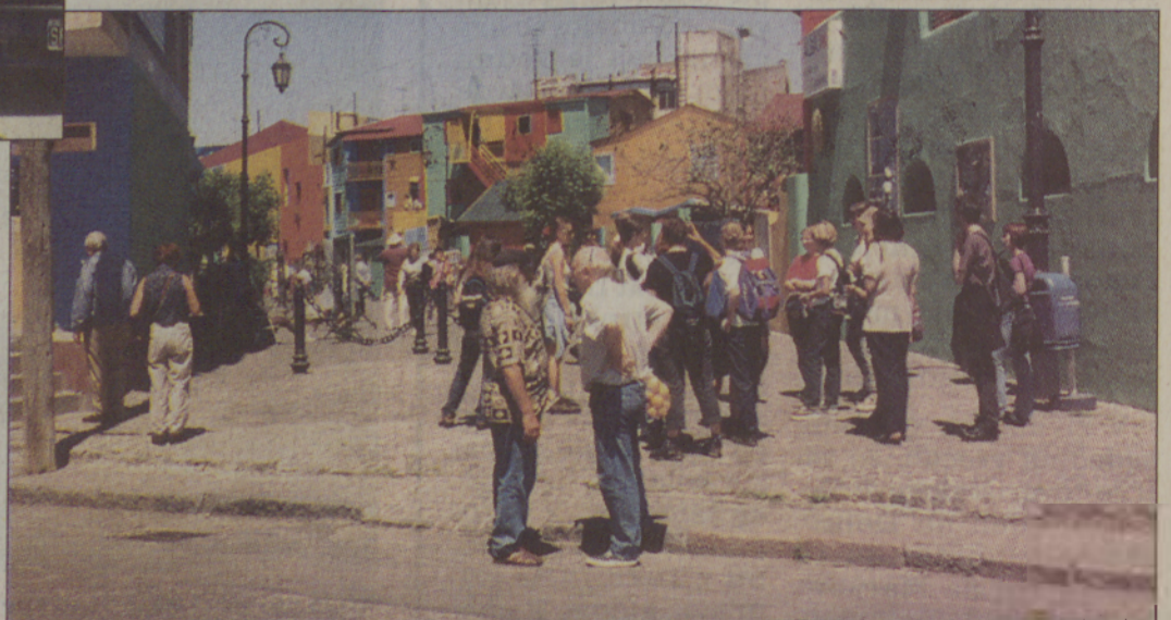
La Boca. Raznobarvna pločevina, ki se smeji pristanišču na drugi strani in sestavlja mozaik celotnega okrožja.