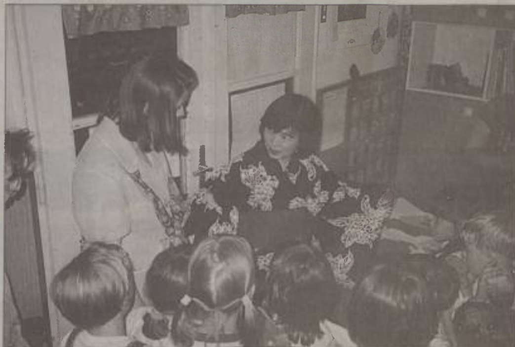
Na obisku v soboškem vrtcu

»Zakonska zveza je zame oziroma za naše združenje ena najpomembnejših stvari, ki obstaja. V življenju vsakega človeka so trije najpomembnejši dogodki: rojstvo, zakon in smrt. Vse kulture na svetu so imele in imajo eno institucijo, kjer sta si moški in