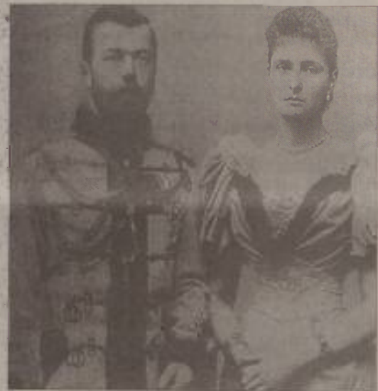
Car Nikolaj II. in carica Aleksandra sta slednjič doživela slovesen pokop v državi, ki ju je ubila.

s tovarnjaka, polnega trupel, njegovo hemofilijo pa so ozdravili z ruskimi naravnimi zdravili. Zda se se novinarji spomnili tudi lažne princeze Anastazije, ki je bila v resnici Poljakinja, kako je desetletja varala evropske kraljevske družine, da je preživela eno najbolj okrutnih likvidacij cesarske dinastije.