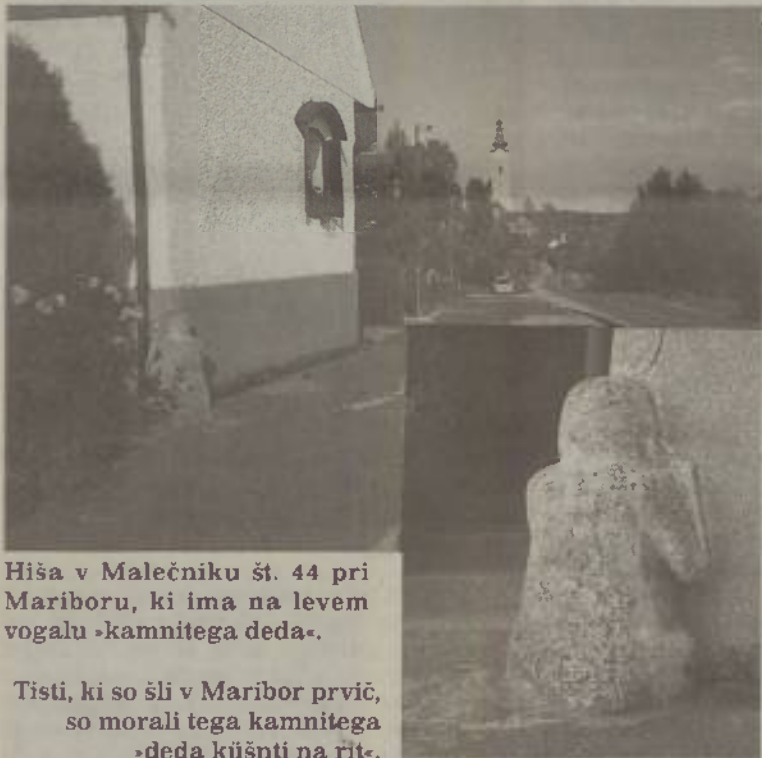
Hiša v Malečniku št. 44 pri Mariboru, ki ima na levem vogalu »kamnitega deda«.

»Spi! Jutri se pomeniva,« je živčno odvrnil in