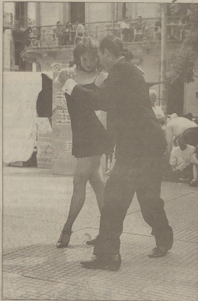
Zapeljivost tanga na San Telmu, kjer je ob nedeljah tudi boljši trg. Ponudba je raznovrstna: od francoskih jakobinskih čepic do brazilskih kamnov.

Puristi se sicer bojijo, da čedalje več mladih zanemarja lepoto tega plesa in tradicije, vendar ... je ritem, je skrita melanholija, ironija in nostalgija v srcu te oddaljene Južne Amerike.