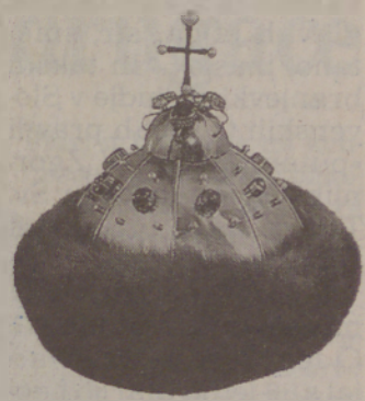
Pokrivalo (krona) carja Petra Velikega.

Po Ameriki kar naprej krožijo razstave, posvečene ruskim carjem. To je del povabila na razstavo v Topeki, Kansas.