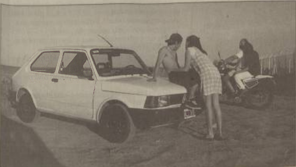
Utrip mladih v večernih urah

so začeli kapljati tudi že kakšni Slovenci ... Ni čudno, da sem zasledila veliko sorodnih evropskih priimkov, slovenski pa so bili pisani v španskem jeziku tako, da ni bilo čutiti domačih šumnikov.