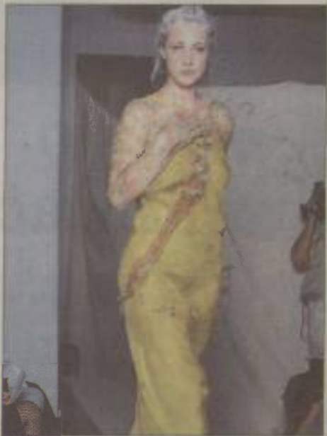
Eden od treh modelov moje kolekcije z naslovom neskončnost. Oblika sledi matematičnemu znaku neskončnosti. Gre za združitev bakreno-svilene čipke in ročno pobarvane svile.

Buenos Aires - kozmopolitski in kontradiktoren, dinamičen in tradicionalen, zgodovinski in moderen in sploh tak, kot je, je lep še posebno novembra, ko se tam prebujata pomlad. Močna svetloba zabriše kontraste in dragulji »evropske« arhitekture zaživijo drugače. Šele proti večeru se začuti odsev vsakodnevne utripa trimilijonskega mesta, katerega del smo bili tudi mi.