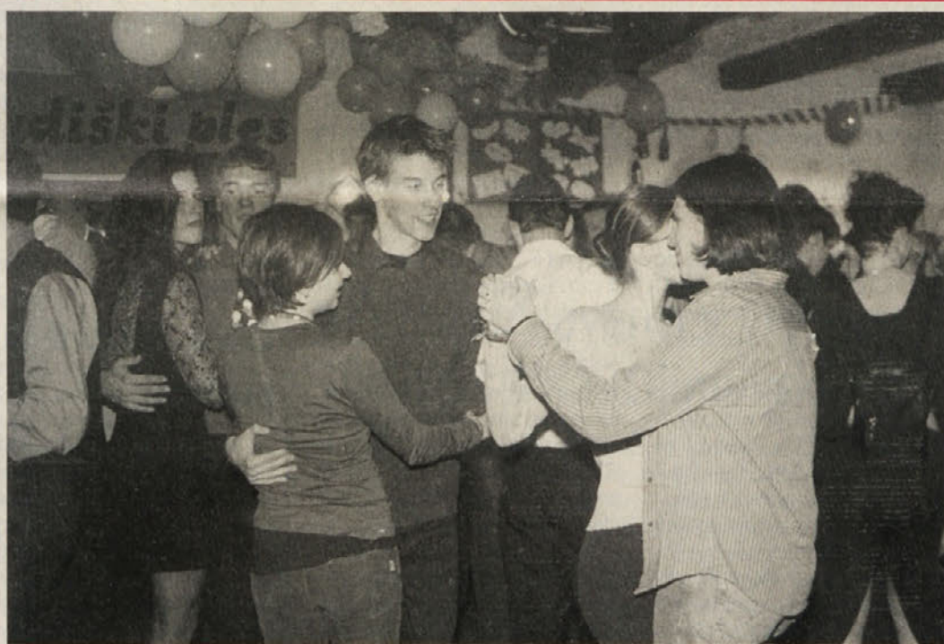
Na Radiškem plesu je bilo silno veselo, plesalci pa so se kljub pomanjkanju prostora prešerno vrteli do jutranjih ur. Ples je obiskalo nekaj znamenitih osebnosti, npr. Bill Clinton in Monika, Fred in Vilma, pa celo Adam in Eva ... Več o tem na strani 4

Ameriško gospodarstvo je na dobri poti in si je po letih upadanja spet opomoglo. Ob dobri finančni situaciji pa Clinton zahteva tudi zvišanje sredstev za vojaške namene in to kar za 12 milijard dolarjev, hkrati pa je zagovarjal tudi pomoč znanstvenikom iz Rusije, ki naj bi lažje našli zaposlitev pri projektih oz. delu, ki je namenjeno civilnemu prebivalstvu. Napovedal pa je tudi večjo aktivnost pri reševanju problemov oz. vojaških spopadov v Kosovu. S. W.