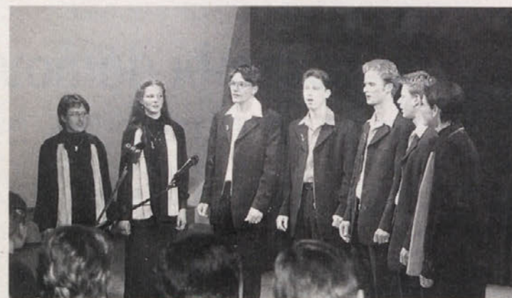
Pevska skupina »VOX« zna navdušiti občinstvo ...