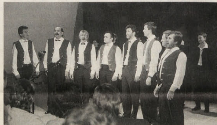
... isto pa velja za že arivirani okteti »Suha«

Koncert sta z majhnim časovnim zamikom pričela okteti Suha ter skupina Vox. Oktetu se, ne da bi hoteli biti zlobni, pozna, da poje že od leta 1981, torej osemnajsto leto. Spremembe so, če odmislimo bogate