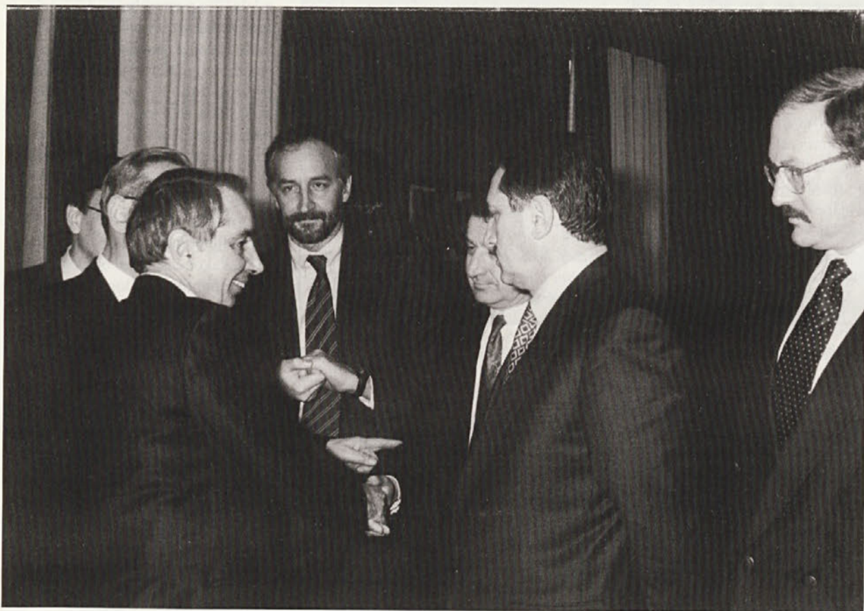
Predsednik italijanske vlade Giuliano Amato na srečanju z deželnimi svetovalci

letel na pozornost vsedravnih krogov in zadobil pri le-teh tudi nujno podporo. V prvi vrsti menimo, da se mora težnja po popolnejšem regionalizmu preoblikovati v potrebo po pravem federalizmu. Regionalna ureditev je namreč po svoji naravi le prehodna, kar potrjuje sama italijanska dvajsetletna izkušnja. Danes je namreč alternativa ali federalna ureditev ali pa vrnitev k predrepubliškemu centralističnemu sistemu, v katerem bi dežele prevzele vlogo starih prefektur. V okviru federalističnega pojmovanja države ni potrebno veliko sprememb; zadostujejo: boljša razvrstitev državnih in deželnih kompetenc, priznanje finančne avtonomije s pravico do uvedbe lastnega sistema obdavčevanja in določena soudeležba pri državnem sistemu obdavčevanja,