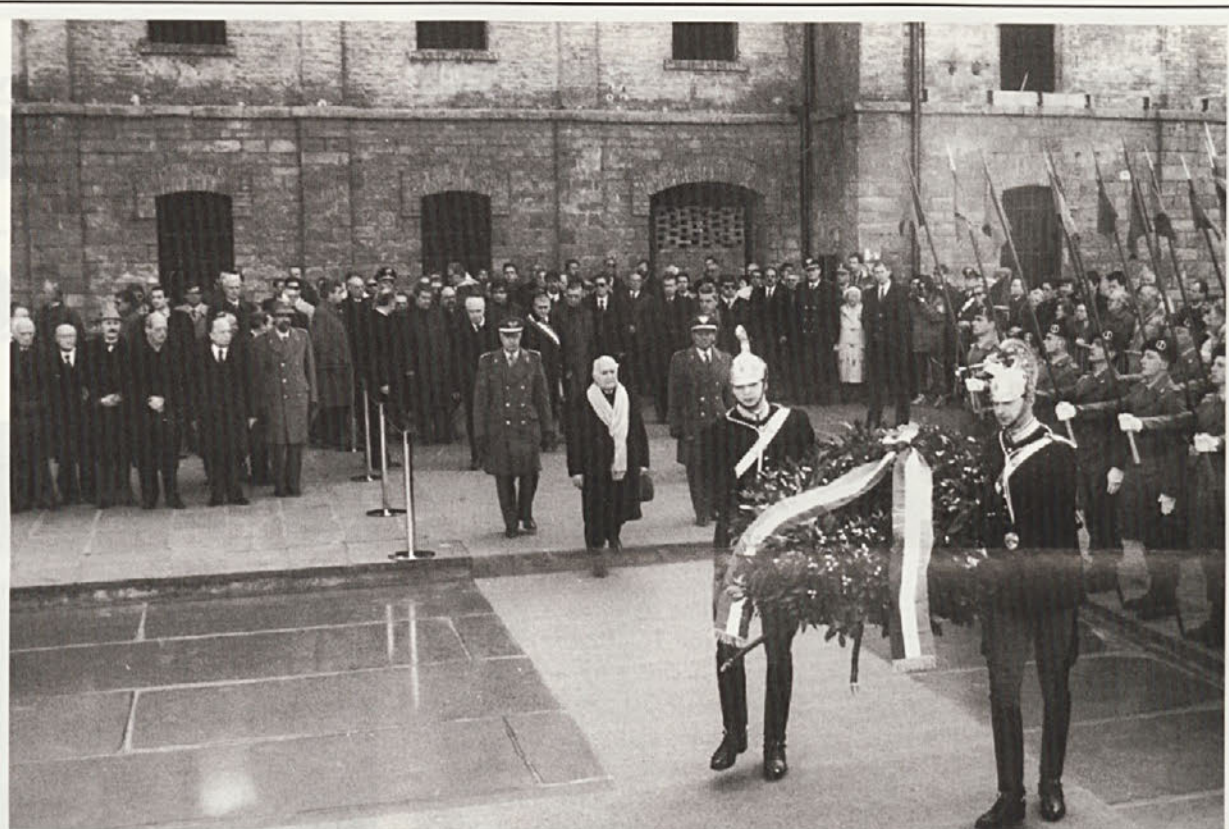
Predsednik Oscar Luigi Scalfaro se je poklonil žrtvam Rižarne.

Ta preobrat, ki je viden v delovanju Rajonskega sveta za Vzhodni Kras jasno dokazuje, da je naša prisotnost v "vladi" potrebna, zato da se uredničijo tista načela, ki smatramo, da so baza vsakega dobrega upravljanja in sicer iskanje, v sodelovanju z vsemi dejavniki civilne družbe, tistih administrativnih posegov, ki lahko prinesejo do rešitve problemov v globokem spoštovanju specifičnosti, ki ga prinaša prisotnost italijanskih in slovenskih občanov.