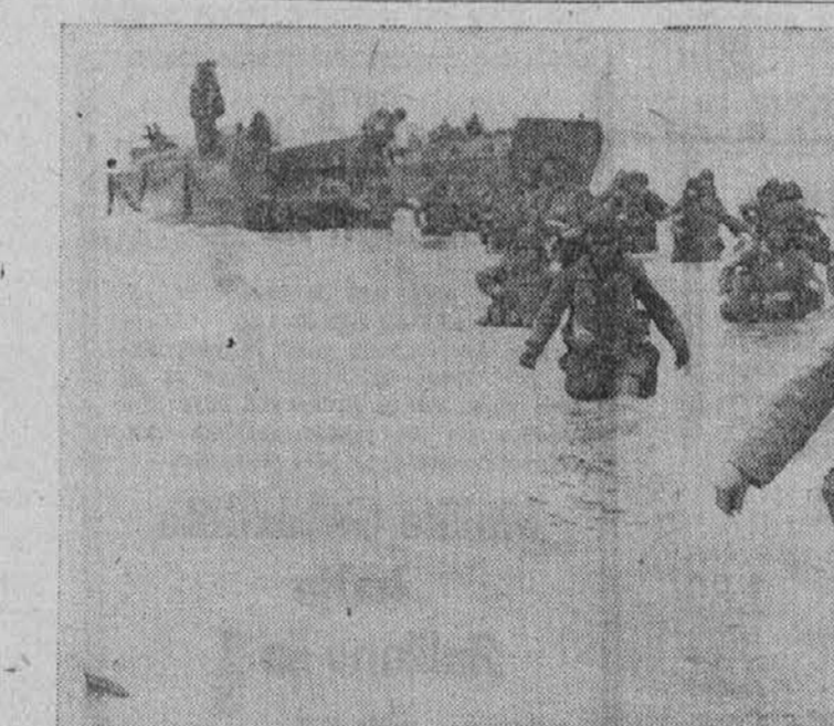
Pomoč prihaja. — Ko so se prve zavezniske čete izkrcle na francoski obali, je bilo treba misliti na takojšnjo pomoč ali ojačenje in gornja slika nam predstavlja ameriške vojake, ki odločno brodirajo proti obrežju, da čimprej prisloščijo na pomoč svojim tovarišem. Ti fantje so bili vsi pripravljani za takojšnje akcije. Daleč v ozadju pa je v senci videti še več različnih brodov, ki so natrpani z raznim materialom za zavezniske čete.

Kot del velike zavezniske strategije, da se čim prej stisne nemško armado v kot ali ob zid na njenih domačih tleh so ruske ofenzive, kot nam kaže gornji zemljevid. Ruske armade so na pohodu preko Poljske do Baltika, druge preko Balkana — Rumunije in glavna armada pa tudi preko Poljske naravnost proti Berlinu. Zavezniki "shuttle" bombniki, kakršnega vidimo na spodnji sliki in ki poletavajo iz italijanskih zavezniskih baz nad nemško ozemlje, pa drže v šahu nemško "Luftwaffe," da jo morajo Nemci držati na vzhodu, ki bi sicer vso dotično zračno silo lahko rabili proti zaveznikom v Franciji. Za take dolge polete iz Italije pa v Rusijo pa je potrebnih tisoče galon "100 octane" gazolina. Ameriške rafinerije, ki delajo noč in dan skrbje, da imajo naši letalci tudi tega dovolj.