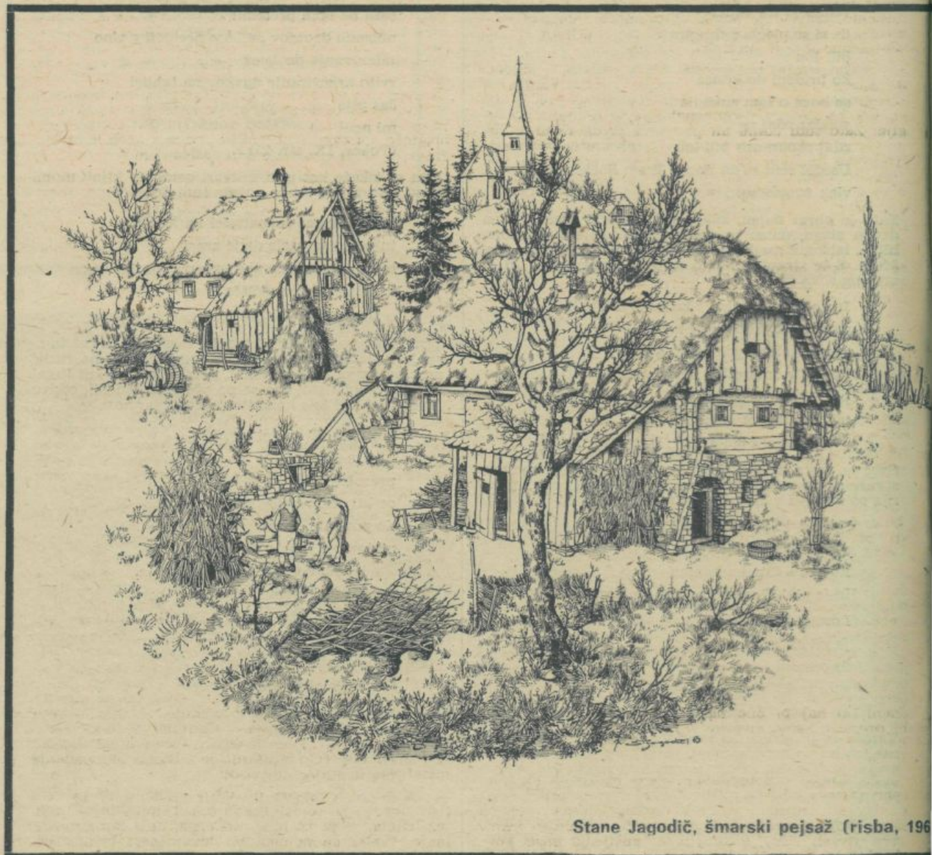
Stane Jagodič, šmarski pejzaž (risba, 1960)