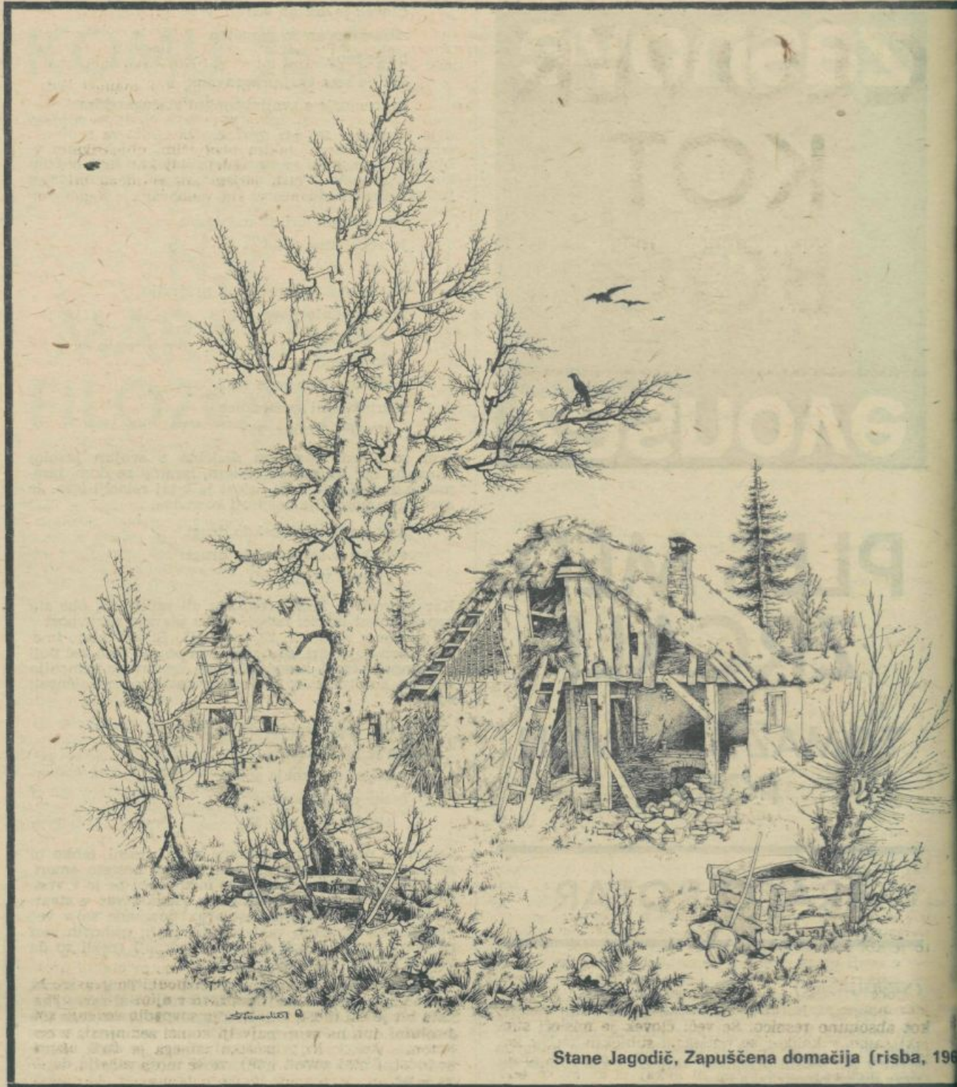
Stane Jagodič, Zapuščena domačija (risba, 1960)