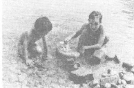
Ta ladjica je pa samo najina ...

»Zdaj sem že petič tu. Zelo rada prihajam semkaj, kajti ves čas se nekaj dogaja. Vsak dan kaj pripravimo za otroke. Med drugim smo izbrali miss in mistra Pacuga, organizirali pacuške »poroke«, pa kviz, ples, modno revijo in nagradili najzvirnejšo obleko. Veliko smo hodili tudi na sprehode v okoliške kraje in pripravili tekmovanje v plavanju,