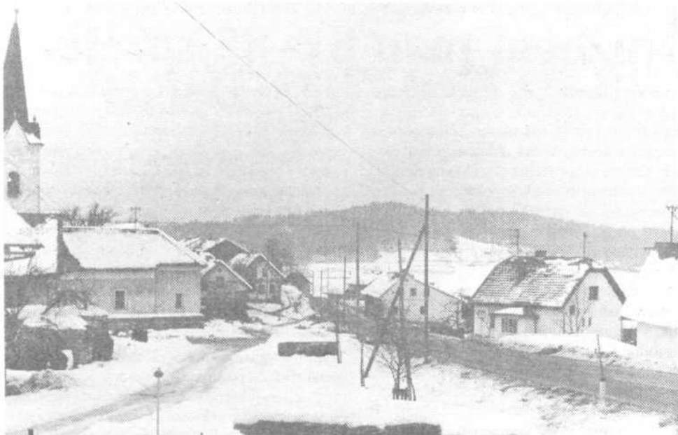
Pijava gorica danes...