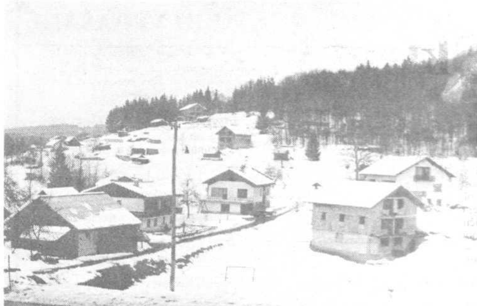
Zametki bodoče Pijave gorice

KS PIJAVA GORICA: TELEFON, VODA, CESTE, ŽIVINOREJA