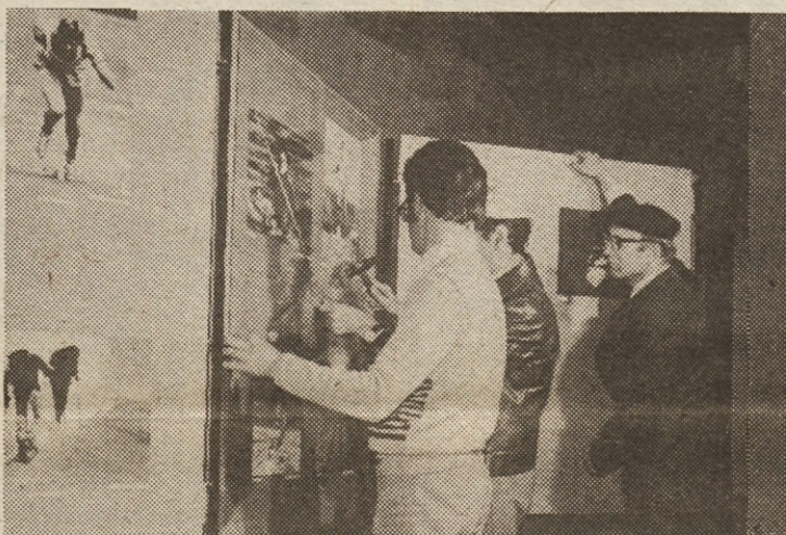
Priprave na razstavo...

prodril v širši jugoslovanski kulturni prostor.