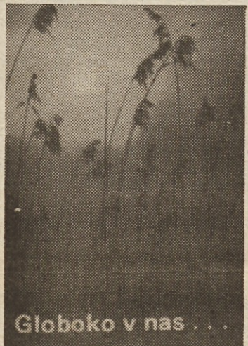
Naslovnica pesniške zbirke, kate avtorji so delavci Iskre.