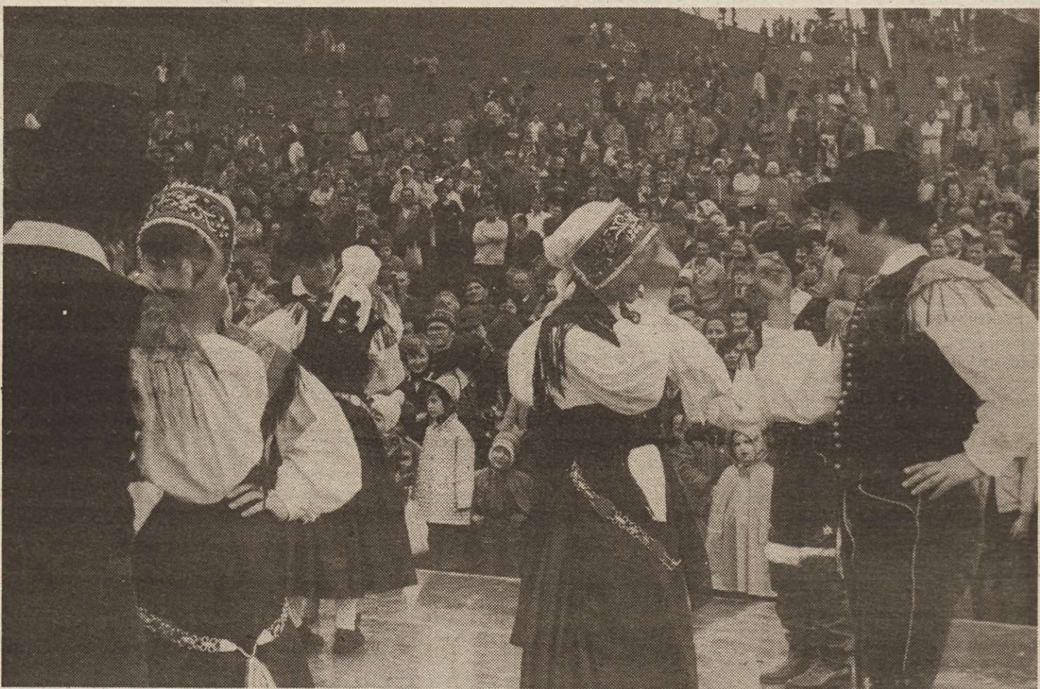
Folklorna skupina Iskra med svojim nastopom na Joštu