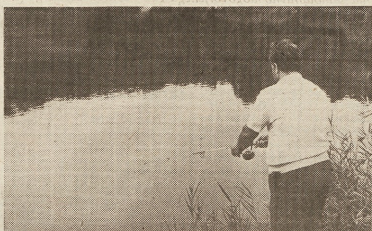
Prijetno in zdravo, brez dvoma — vendar brez sodobne tehnologije slovenski ribiči ne bodo uspeli napolniti naših miz s to kakovostno hrano

S podobnimi težavami so se otepali tudi solinarji in pomorci