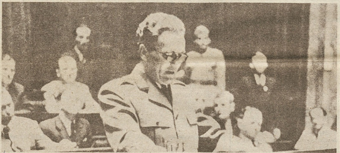
Predsednik ministrskega sveta DFJ maršal Josip Broz Tito za govorniškimi odrom tretjega zasedanja AVNOJ (10. avgusta 1945).

Naša dežela je strahovito opustošena in izropana. Glavna krivca za to puščevino je sta Nemčija in Italija. Doslej nam nista vrnila ničesar od tistega, kar sta izvozili in izropali iz naše dežele, a kaj šele, da bi nam poravnali storjeno vojno škodo. Edino Madžarska (vodstvo nove Jugoslavije je bilo glede vprašanja reparacij — vojne odškodnine — ki bi jih morale plačati Madžarska, Romunija in Bolgarija, zelo širokogrudno, ker je izhajalo iz sta-