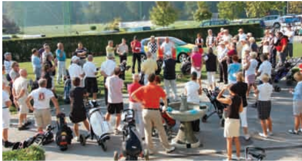
Na Pubijevem srečanju

družabnosti v golfski igri. Veliko o priljubljenosti rekreativnega ukvarjanja z golfom pove podatek, da je na zaključnem turnirju PUBI (avtor zgodbe) gostil več kot 150 igralcev. Bravo, Pubi! Ker časi niso rožnati in sponzorji precej težje sofinancirajo njihove dejavnosti, so tudi letos z avkcijo slik zaključili že sedmo slikarsko akademijo po vrsti - tokrat Arboretum 2011. Z uspešno prodajo doniranih umetniških stvaritev so