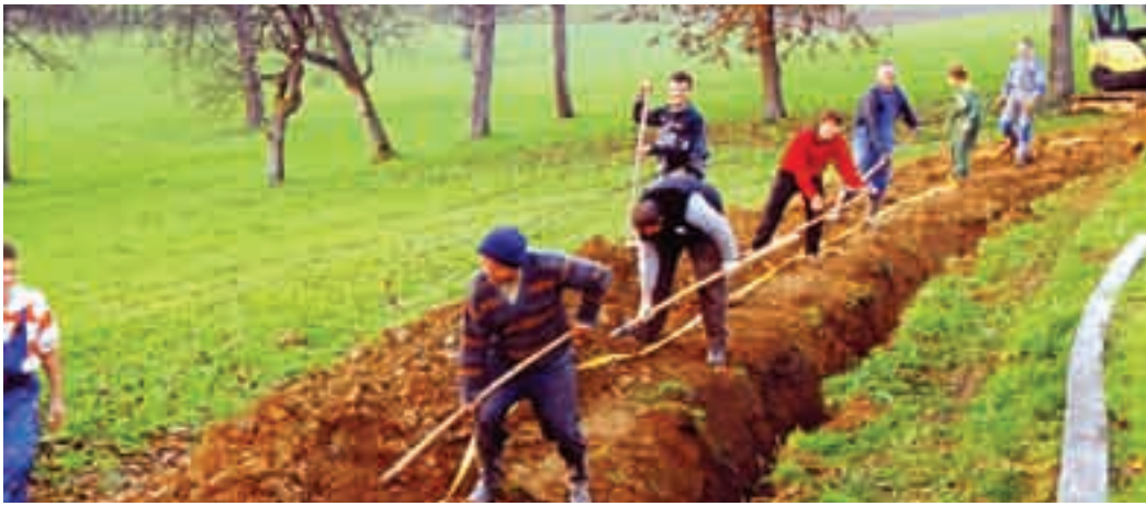
Krajani pri delu