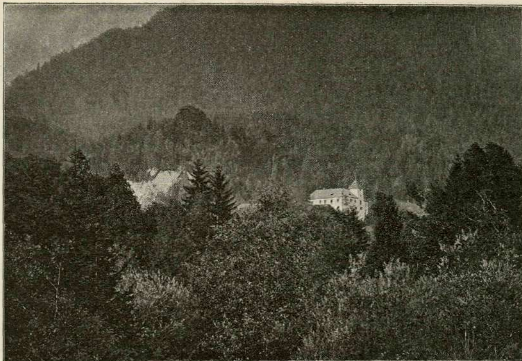
Grad Turn pri Preddvoru.

vanske zgodovine, nam jo kažejo iskreno, duhovito in verno Slovenko. Da je poznala natanko Prešernove pesmi in znala „Krst pri Savici“ na pamet, na to nas opominjajo nekatera mesta v njenih spisih, kakor: „Strašen boj je bil, — bilo je mesarsko klanje“, „Na tleh leže najmočnejši stebri slavjanstva“, „Srčnost ji vžiga rdeča lica“ idr.