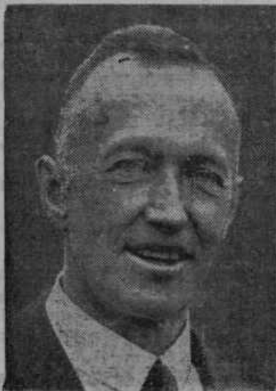
Amerikanec Lincoln Ellsworth pripravlja odprmo na južni tečaj.

Sv. Peter pri Mariboru. Dne 8. maja je bila pri nas slovesna otvoritev banovinske ceste Sv. Peter — Lečane, ki je velike gospodarske, tujsko-prometne in narodnostne vrednosti. Velika pridobitev je posebno za svetolenarški okraj, ki ima skrajšano pot v Maribor za 5 km ter ima tudi bivša ob-