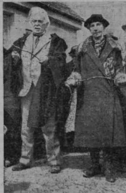
Stari Lloyd George, znameniti angleški državnik, se ukvarja v političnem pokoju z odkrivanjem vodnih žil na svojem posestvu s pomočjo leskove šibe. Poleg Georgeja stopa ženski iskalec globoko pod zemljo skritih vrečev.