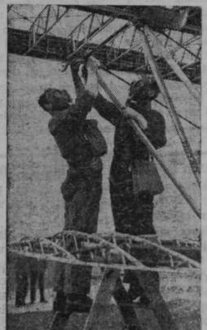
Delavstvo, ki je zaposleno pri izdelovanju ameriških letal, dela stalno s plinskimi maskami, da se navadi za primer vojne nevarnosti.

Apače. Danes nekoliko omembe vrednih dogodkov iz naše kotline izza meseca maja. Dne 16. maja smo imeli kramarski in živinski sejem. Dočim je bilo prejšnja leta prignane zelo malo živine, je bilo letos skoraj petdeset glav goveje živine. Cena se je sukala od 4 do 4.50 din za kg. Primanjkovalo je kupcev, znak, da tudi v rodovitni Apački kotlini primanjkuje denarja. — Četrto nedeljo v maju je bila v Freudenauu proslava materinskega dne. Zelo ljubek je bil nastop otrok otroškega vrtca, ki so — strašno pokazali, kaj znajo. Dočim je bila prejšnja leta materinska proslava popolnoma nemška, je bila letos v slovenskem in nemškem jeziku. — Naša polja in travniki ob Muri so na širino nad en kilometer utrpeli ob vsej dolžini struge strašno škodo. Krma je obetala biti zelo pičila, a sedaj je še to uničeno. Tudi setev je ob vsem desnem obrežju Mure zelo poškodovana. Kraji, severno od glavne ceste, so po vsej kotlini zelo prizadeti. Na dan najvišje povodnji je bil sredi dopoldneva prekinjen šolski pouk. V Gorrijem Cmureku so