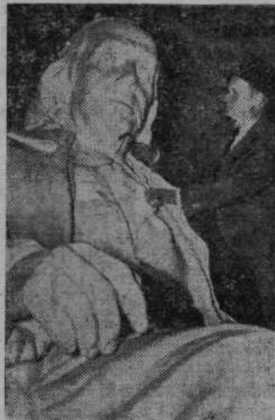
Orjaški kip Benjamina Franklina bodo odkrili v Filadelfiji v Združenih ameriških državah. Kip tehta 120 ton. Poleg kipa vidimo kiparja I. E. Fraserja.

čina Sv. Peter in sedanja občina Sv. Marjeta velike ugodnosti, ker odpadejo s tem veliki stroški za vzdrževanje starih občinskih klancev. Prebivalstvo vse širše okolice pozdravlja z velikim veseljem to velikansko pridobitev ter se zahvaljuje vsem, kateri so količkaj pripomogli k gradnji ceste, najbolj pa tistim, kateri so položili temeljne kamne za to cesto in jo nadaljevali. — Kakor pri vsakem dobrodelnem delu in v vsakem cirkusu se pa najdejo tudi avgusti, kateri dobro stvar zanikajo in kritizirajo. Ob času graditve humske ceste je vložila bivša občina Sv. Peter priziv, da ta cesta ni potrebna, čeprav so se zavedali, da jo bo gradila banska uprava. Obžalovanja vredno je, da se je izrazil neki gospod od Sv. Petra nedavno proti načelniku cestnega odbora, da ta novozgrajena cesta z Sv. Peter nima nikakšnega gospodarskega pomena, ker bodo po njej hodili gotovi ljudje in kradli. Pripravljalni odbor za otvoritev ceste je dobil od raznih posestnikov-vinogradnikov podarjenega 750 litrov vina z namenom, da se to vino zastoj razdeli povabljenim gostom, večinoma pa delavcem, kar se je tudi zgodilo. Zaradi tega je banska uprava to vino