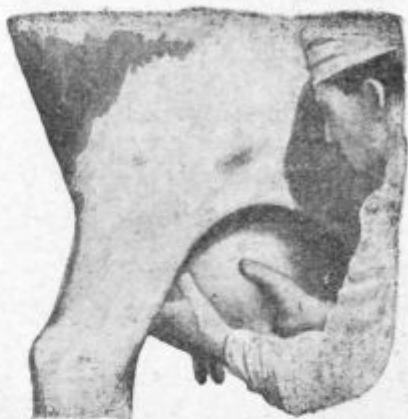
Pod. 16. Prednja in zadnja desna mlečna žleza se stisneta in obenem privzdigneta.

Najprej je molzti sprednja sesa in sicer levega z desno roko, desnega z levo. Roko je privzdigniti, ko se molze, do vimena, katero se še nekoliko navzgor pritisne. Pri tem je roko odpreti v toliko, da se ses rahlo objame a čim se je zajelo pest mleka, povese se roka v toliko, da pride ses v prvotno dolžino. Obenem, ko se roka poveša, pritiska se s prsti od zgoraj vedno bolj navzdol, da teče