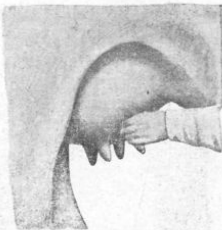
Pod. 20. Konečna molžnja.

Tako uči Hegelund. Njegov način je sicer na prvi pogled nekoliko kompliciran, vendar ni posebna težava privaditi se mu. V glavnem obstoji v izžemanju mleka iz mlečnih žlez. Od mlade krave, ki je dajala 9 l kg mleka na dan, povečala se je, kakor pravi Hegelund, množina mleka že po 6. dnevu njegove molžnje na 17 kg . Druga mlada krava, ki je dajala 5½ do 6 kg mleka na dan, se je molzla po popisanem načinu tri tedne in sicer vsak dan po 7 krat. V tem času je poskočila množina mleka na 14½ kg . Ta mlečnost pa se je tudi potem obdržala, ko se je kravo zopet po trikrat na dan molzlo.