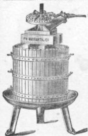
Stiskalnica za vino.