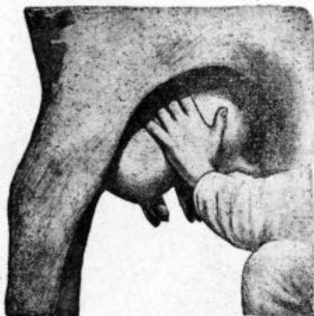
Pod. 18. Prednja desna mlečna žleza se stiska od strani in od sredine.

prednjo in zadnjo desno mlečno žlezo (v vimenu so 4 med sabo neodvisne mlečne žlezi) tako, da prideta palca na zadnjo stran