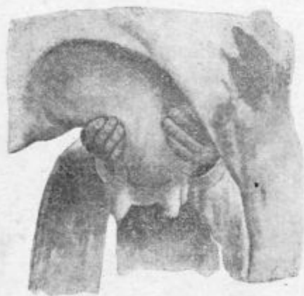
Pod. 17. Prednji mlečni žlezi se stisneta skupaj.

mleko v jednomernem in nepretrganem curku. Od početka je molzti počasi. Posebno je paziti na to, da se ses ne nateguje, ker bi krava lahko pridržala mleko. Molžnje naj se ne prekine marveč molzti je brez presledka in razun koj v začetku, kolikor mogoče hitro. Ko se pomolzeta prednja sesa, začneta se molzti na isti način zadnja a ko prihaja tudi iz teh le malo mleka, prične se s čisto molžnjo.