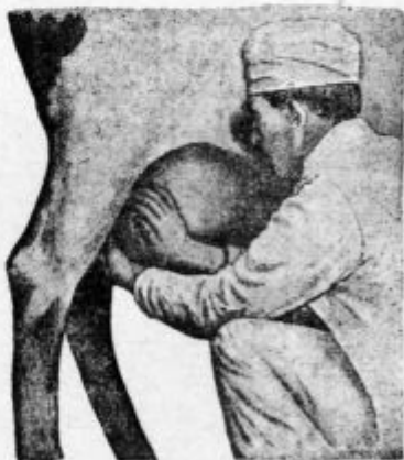
Pod. 19. Zadnja desna mlečna žleza se stiska od strani in od sredine.

Ko je sprednji del vimena prazen, pomolze se na isti način še zadnji in delo je končano.