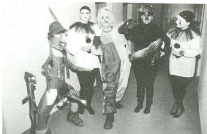
Na pustni torek so gozdarji slovenjgraškega obrata popestrili dan neporočenim delavkam skupnih služb s plohom, ki so ga posebno skrbno pripravili, kar se vidi tudi na fotografiji.