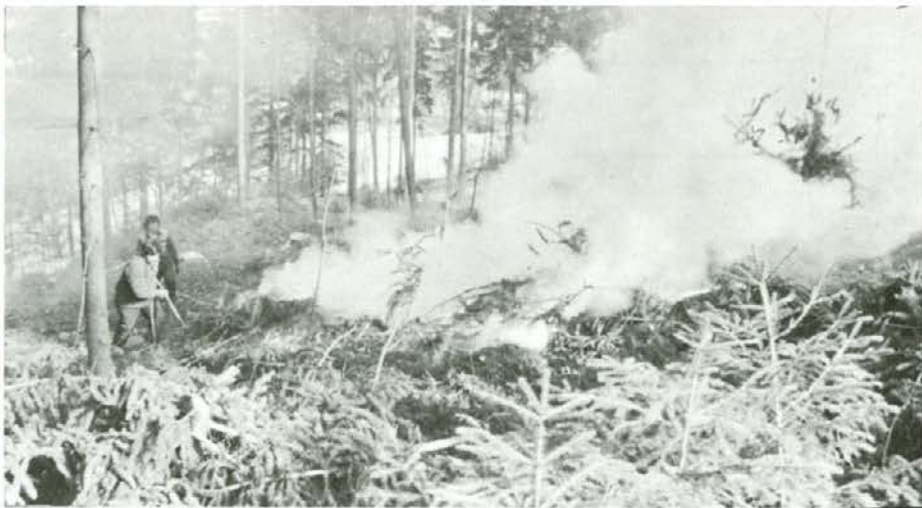
S požigom proti lubadarju