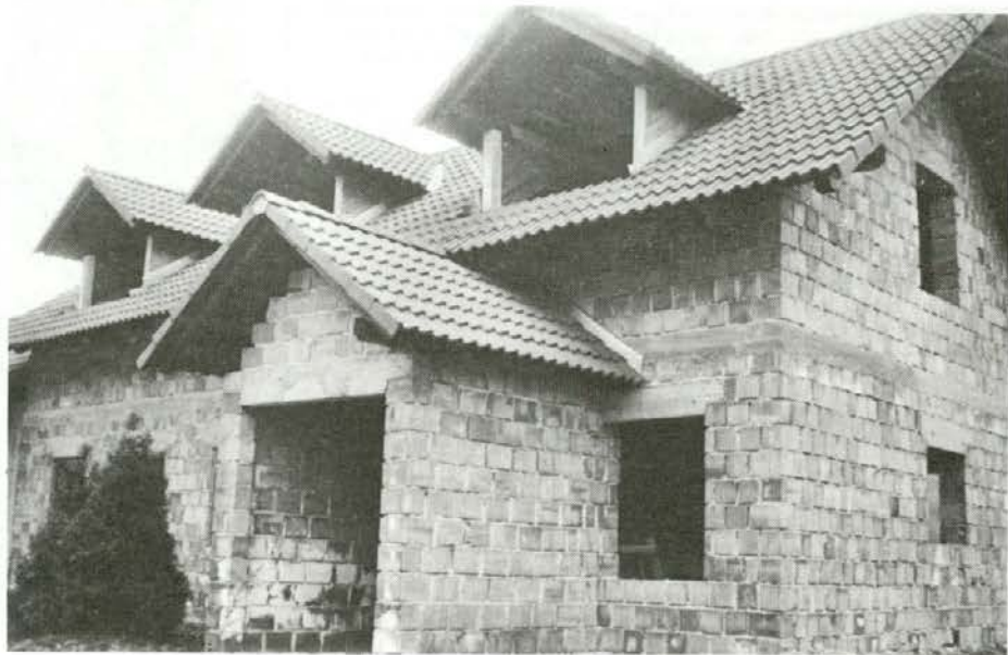
Gradnja dnevno-varstvenega centra »Ivančica« v Trobljah pri Slovenj Gradcu je pod streho, vendar bo treba zbrati še veliko sredstev za dokončanje