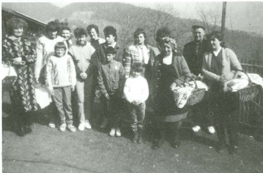
Na veliko soboto

Mi otročaji pa smo se veselili velikonočnih daril botrov ali pisank kot smo jim po domače rekli, pa čeprav so bila ta darila še tako skromna in so sestavljale le partelj in pisanko. Če pa je bil priložen še kakšen novec in pomaranča, pa je to bilo že pravo razkošje.