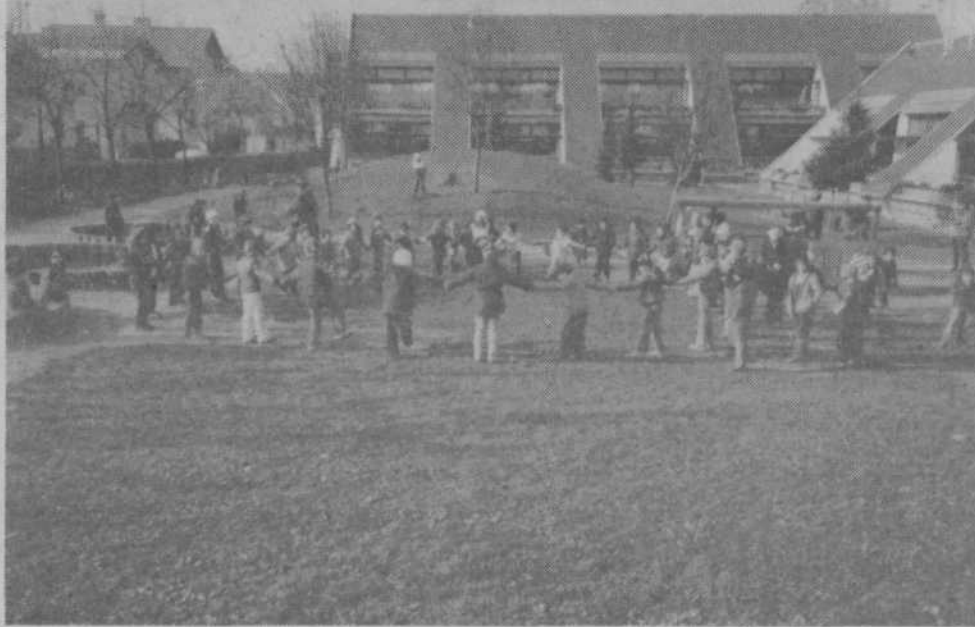
35 LET VVO CICIBAN