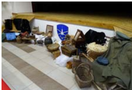
Razstava starih predmetov

ru projekta Kultura srca – srečanje z rojaki iz Nemčije si je ogledalo več kot tristo obiskovalcev, kar ocenjujemo kot dobro, saj tovrstne zadeve v zadnjih letih pravzaprav izgubljajo pomen, ker niso dovolj »odmevne«, verjetno tudi ne prepoznavne, medijsko ne ravno privlačne, sploh pa niso zaslužkarske in dobičkonosne, niti za društva, za posameznike pa sploh ne. In zato ravno v tem, poleg druženja in aktivne izrabe prostega časa, vidim pravo ter največjo vrednost in pomen. Delati nekaj, ustvarjati, se družiti v prostem času ter pri tem ne misliti na zaslužek in materialne dobrine, je v zadnjem času vse večja redkost in bolj izjema kot pravilo.