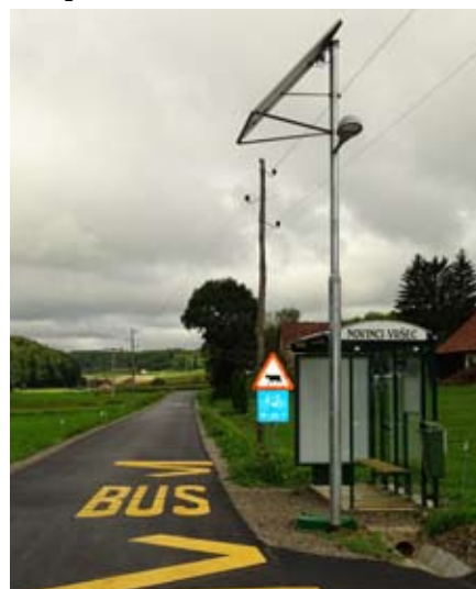
Novo avtobusno postajališče in javna solarna LED razsvetljava

projektov in izvedbo gradbenega nadzora, od tega smo dobili 285.722 € nepovratnih sredstev iz EU.