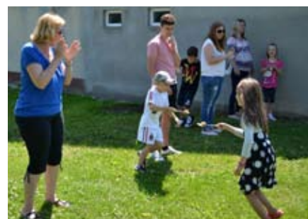
Dogajanje na delavnicah

Na začetku julija smo, letos že petnajstič po vrsti, za osnovnošolske otroke iz naše občine izvajali kreativne delavnice (prvič smo delavnice izvajali leta 1999). Otroci so skupaj s prostovoljkami, članicami našega društva, izdelovali nakit (zapestnice, verižice ipd.), kape iz papirja, se igrali razne igre na prostem (skakanje z vrečo, podajanje jajca ali krompirja na žlici ipd.), risali z ogljem in si pod vodstvom g. Kupčiča ogledali Hrsgovo domačijo ter ustvarjali likovne izdelke v duhu tematike, vezane na »stare čase«.