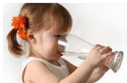
Kmalu pitna voda iz naših vrtin