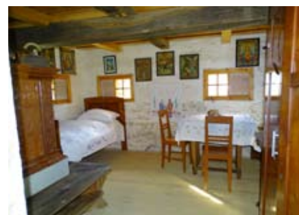
Notranja ureditev preužitkarske hiše (Hrgova hiša)