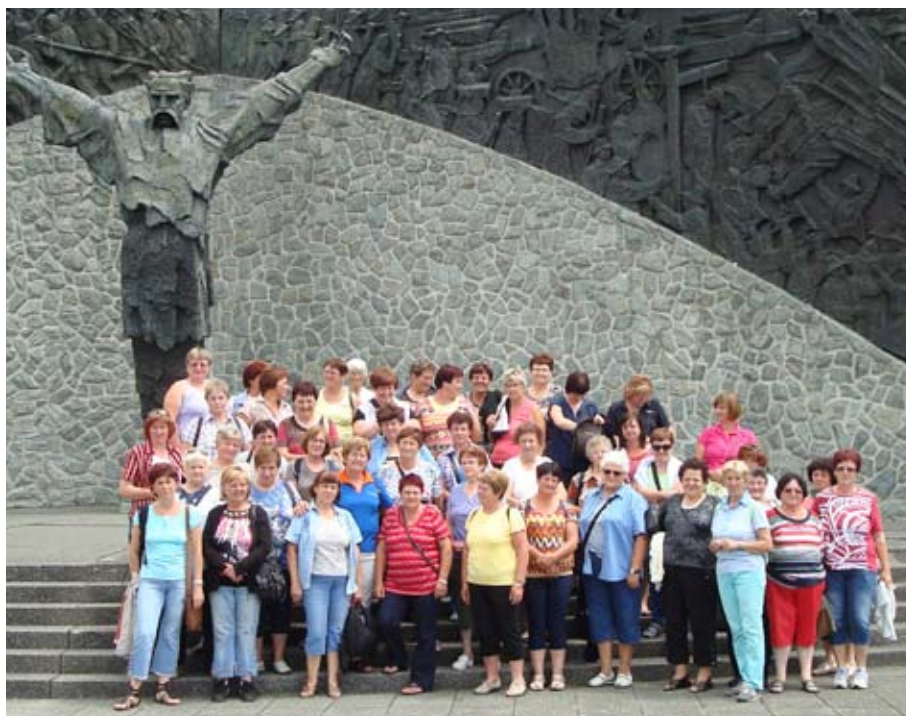
Pred spomenikom Matiji Gubcu in ostalim kmečkim upornikom

Gospodinj smo se 5. julija 2014 ob 7. uri zjutraj odpeljale na strokovno ekskurzijo v Hrvaško Zagorje. Sledila je prijetna vožnja do mejnega prehoda Cvetlin, kjer smo prestopile mejo. Naš prvi postanek je bil v kraju Lepoglava, ki je poznan predvsem po kaznilnici, kjer je bil zaprt Tito, pa tudi Stepinac (kaznilnica je nastala iz prej zelo aktivnega samostana). Tam smo si ogledali tudi cerkev. Kraj je še poznan po znamenitih čipkah. Obiskali smo zadrugo lepoglavske čipke, kjer smo dobile informacije o njihovi izdelavi. Pot smo nadaljevali v Gornjo Stubico, kjer nam je prijazna kustosinja v dvorcu plemiške družine Oršič iz 18. stoletja predstavila zgodovino kraja, dvorca in potek kmečkih uporov. Največji kmečki upor na tem področju je v letu 1573 vodil Matija Gubec. Ogledale smo si Augustinčičev spomenik, ki je posvečen Matiju Gubcu in ostalim kmečkim upornikom. Nato smo nadaljevale pot mimo Stubiških in Tuheljskih Toplic v kraj Desinić, kjer nas je na kmečkem turizmu Grešna gorica čakalo kosilo. Medtem ko smo uživali v odlični hrani