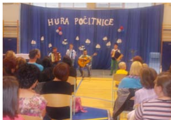
Mladi glasbeniki, 4. razred