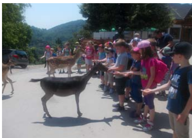
Košute jedo iz rok