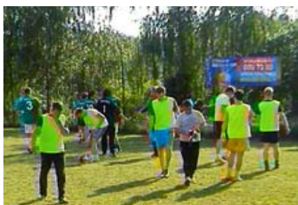
Priprave na tekmo

Športno društvo Rosa je tudi letos organiziralo Turnir v malem nogometu na travnatem igrišču pri Vladu Krambergerju v Novincih, ki je poskrbel za prijetno glasbo in ozvočenje. Turnir smo imeli na lepo, sončno soboto, 10. maja 2014. Sodelovalo je sedem ekip, to so bili domačini in nogometaši iz okoliških krajev. Zmagala je ekipa iz Maribora. Na koncu smo, kakor v preteklih letih, imeli priložnost pogledati, kako se pomerijo naši najmlajši nogometaši in njihovi očetje.