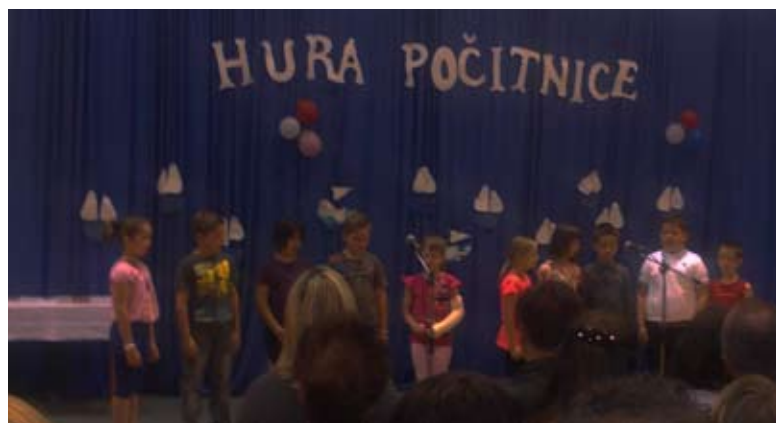
Tretješolci razmišljajo o domovini

Predstavljamo vam nekaj utrinkov z zaključne prireditve.