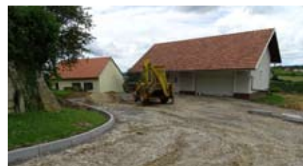
Priprava podlage za asfaltiranje parkirišča