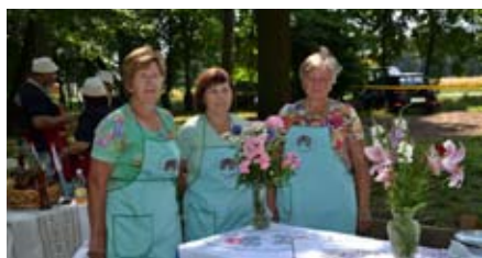
Na tekmovanju praženega krompirja v Dornavi

Etnografsko društvo Cigani Dornava je 28. junija 2014 znova organiziralo 3. krompirfest – tekmovanje v praženju krompirja v grajskem parku pri baročnem dvorcu v Dornavi. Na tej prireditvi so naše članice sodelovale