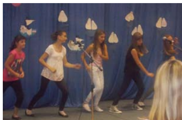
Ples 5. in 6. razreda