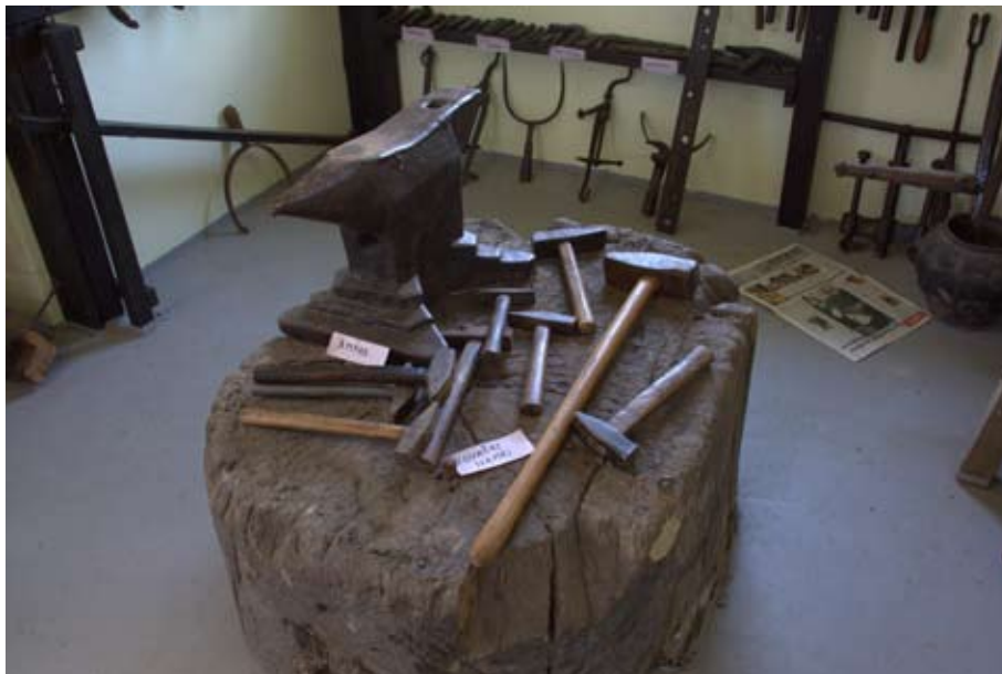
Pogled v notranjost muzeja