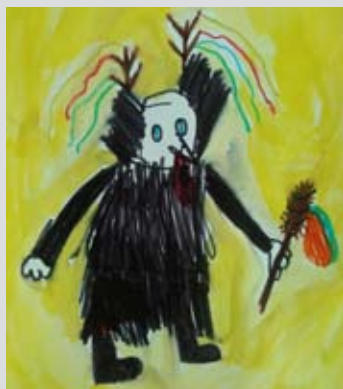
Kurent, Taja Pučko, 1. b