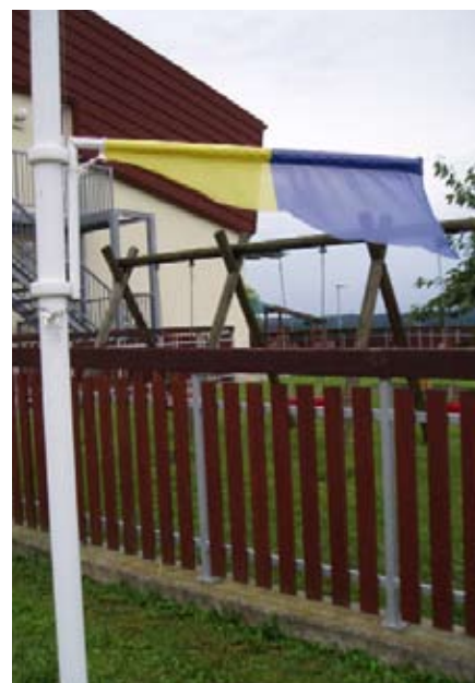
Odrezana občinska zastava