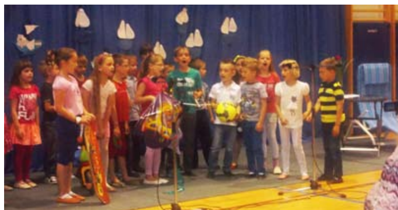
Letos smo se zabavali pri angleščini