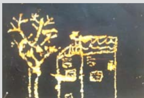
Praskanka, Aneja Grnjak, 1. b