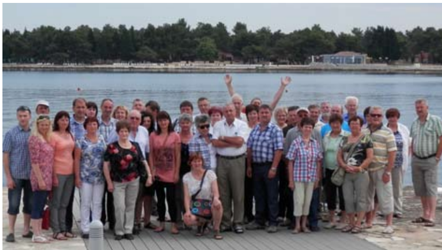
Jutro ob morju v Umagu

Sledil je obisk podjetja Agrolaguna Poreč, kjer se primarno ukvarjajo z vinogradništvom pa tudi z oljkarstvom, mlekarstvom in sirarstvom. Med njihovimi vinogradi smo se popeljali kar z avtobusom, saj največja parcela vinograda v enem kompleksu meri celih 270 hektarjev, njihova klet pa ima kapaciteto 7,5 milijona litrov vina. Seveda je sledila pokušnja njihovih vin, oljčnih olj, sirov in pršuta na njihovem posestvu Tar.