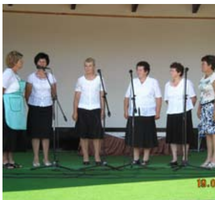
Ljudske pevke v Termah Ptuj

Mnogi turisti so se v kasnejših dneh odpravili na ogled turistično-kulinarčne ponudbe v Sv. Ano in Benedikt, katerih turistične kmetije in ostali ponudniki so se ta dan predstavili v Termah Ptuj.