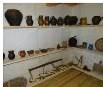
Razstava posode v zadnji sobi