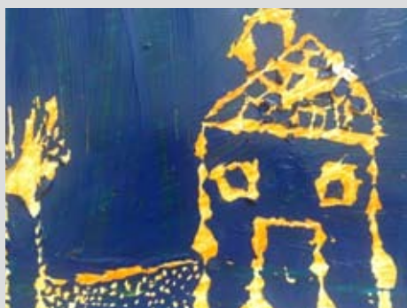
Praskanka, Sara Krepša, 1. b