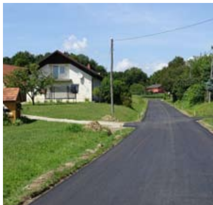
Zaključni sloj (fini asfalt) v Novincih mimo Brotšnajerjevega vodnjaka

Vrednost celotnega projekta znaša 552.000 € vključno z izdelavo