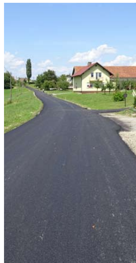
Zaključni sloj asfalta