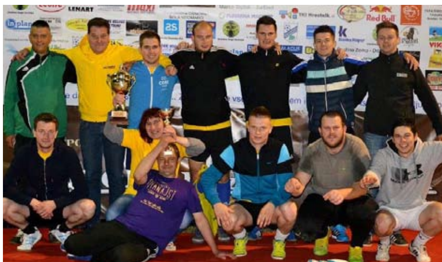
KMN – prvaki občine DRBETINCI

Ob gledanju dobrih nogometnih tekem je bilo še obilo zabave (za katero je posebej poskrbel še gost Damjan Murko) in dobro volje, zato je turnir minil, kot bi trenil in na koncu lahko zapišemo le sklepno misel za 14. tradicionalni