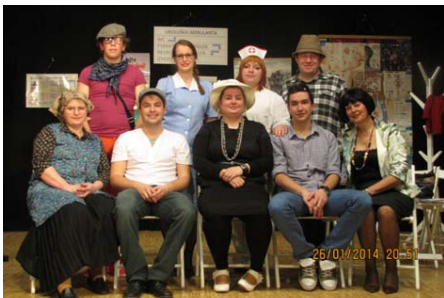
Vitomarški igralci — »Norci pred ambulanto«

Člani Odrasle gledališke skupine KUD Vitomarci smo zadovoljni z oceno, saj pri nastajanju predstave in tudi pri posameznih ponovitvah resnično uživamo. Čeprav včasih pridejo tudi trenutki, ko se malo »grdo«