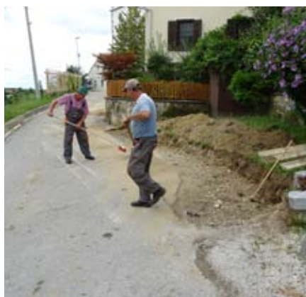
Priprava terena pri spomeniku talcem

ril tudi cestni priključek pri spomeniku talcev, ki ga vsi uporabljamo. Naj poudarim, da nam brez občine Sv. Andraž v Slov. goricah vse to ne bi uspelo, saj je financirala nabavo robnikov, prav tako bo financirala preplastitev vseh asfaltnih površin okrog cerkve ter parkirnih prostorov pred garažo in Župnijsko Karitas. V zameno je župnija občini podelila služnost vožnje in hoje po cesti, ki pelje mimo cerkve in bara Šilec. Omenjeno je še en dokaz več, da je z medsebojnim sodelovanjem mogoče veliko narediti.