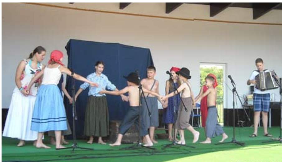
Mladi KUD-ovci so zaigrali Pavlihovo radovednost

Kar dve soboti, in sicer 28. junija in 19. julija 2014, je svojo vinsko ponudbo predstavilo in ponudilo Vinogradništvo Druzovič s proizvodi SISI.