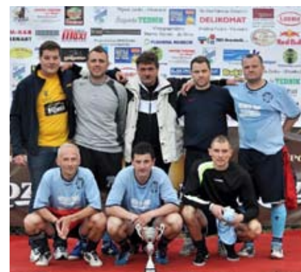
KMN – ZMAGOVALCI MED VETERANI; Prijatelji gostilna 29 Lenart

Finale: Prijatelji Gostilna 29, ŠD Vitomarci: 2 : 0.