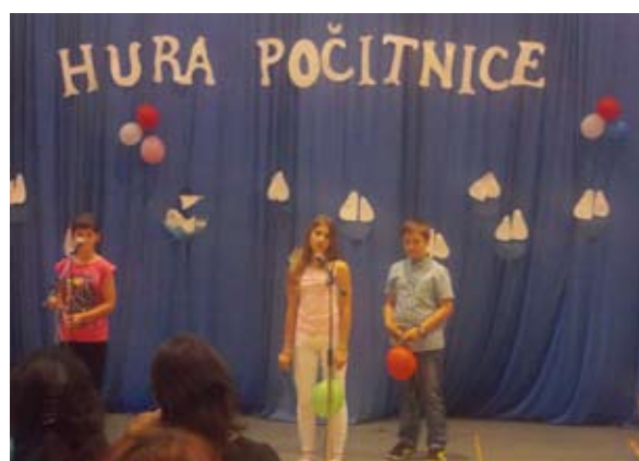
Balončki – 5. razred