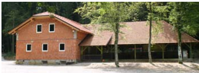
Lovski dom v Müzäh