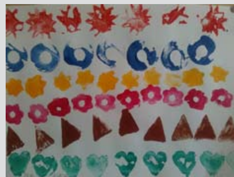
Krompirjev odtis, Taja Pučko, 1. b, in Aneja Grnjak, 1. b