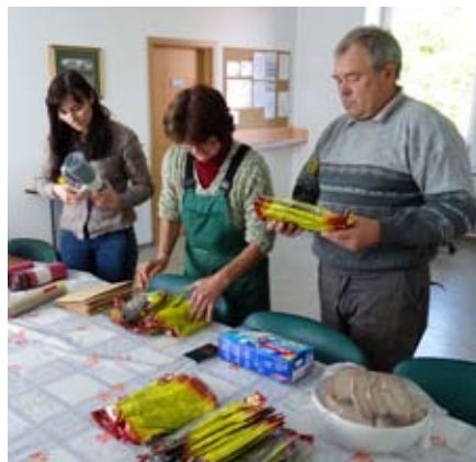
Priprave na čistilno akcijo

močnejši od tistih, ki ravnajo tako nespametno.