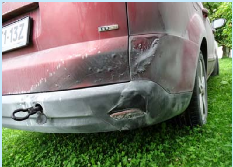
Županov avtomobil – posledica zažiga