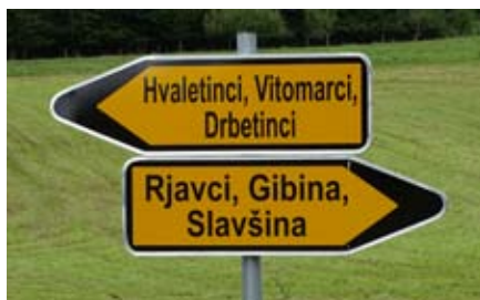
Usmerjevalna tabla – kažipot