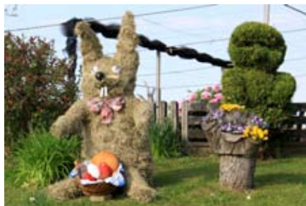
Velikonočni zajček iz slame