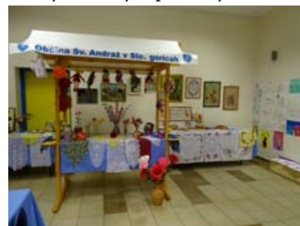
Razstava izdelkov naših gospodinj

Če je v vaši moči (in interesu), vas »povabim«, da pomagate še naprej. Ne pozabite – ljudje v stiski potrebujejo za najosnovnejše preživetje vse, kar