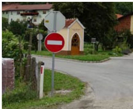
Enosmerna cesta Drbetinci

V križišču pri kapeli v Sp. Drbetincih je postavljen nov prometni znak za prepoved, in sicer za enosmerni promet, kar pomeni, da je iz smeri Trnovska vas zavijanje levo proti avtocesti dovoljeno na drugem kraku. Na ta način je uveden neke vrste krožni promet, saj na to nakazuje tudi prometni znak obvezna smer, ki usmerja promet iz smeri Čagone desno od kapele.