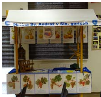
Stojnica sadjarjev in vinogradnikov