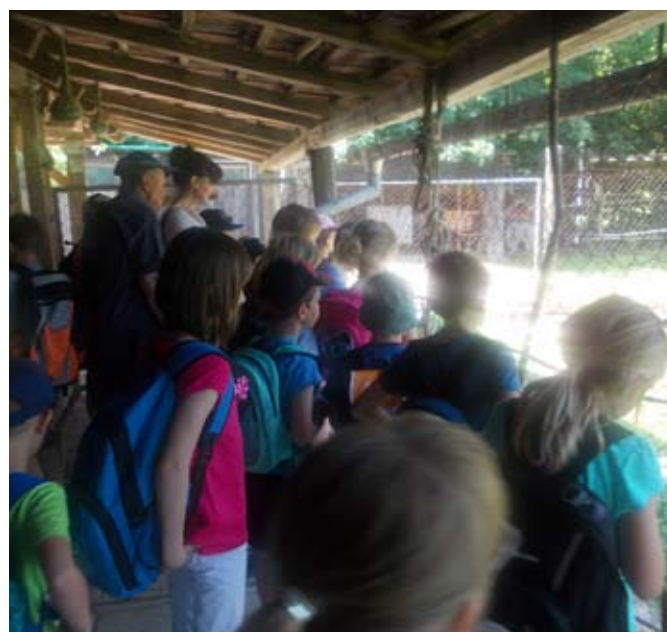
Na kmetiji Mraz