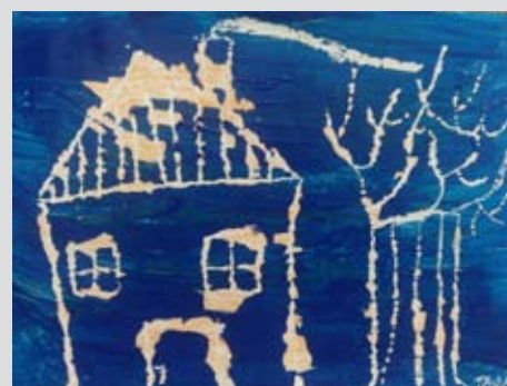
Praskanka, Taja Pučko, 1. b