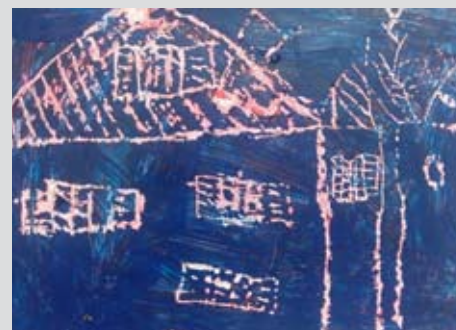
Praskanka, Domen Kokol, 1. b