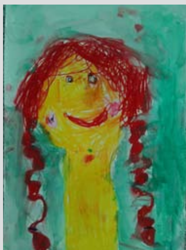
Pustna šema, Lana Lovrenčič, 1. b