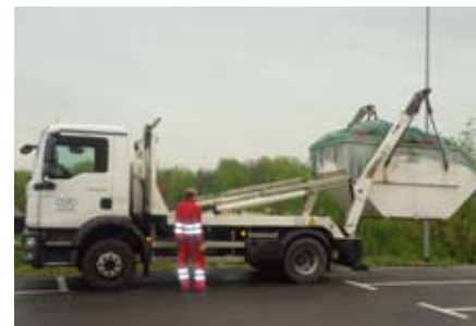
Odvoz zbranih odpadkov