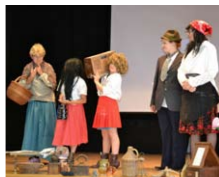
Igra za otroke na delavnicah

V avgustu namreč domače društvo upokojencev praznuje 30 let obstoja oz. delovanja in smo za to priložnost z otroškimi risbicami že okrasili zadnjo steno v Večnamenski dvorani Vitomarci. Otroke smo peljali tudi v kino v Maribor. Projekt so finančno omogočili naša občina in starši otrok.