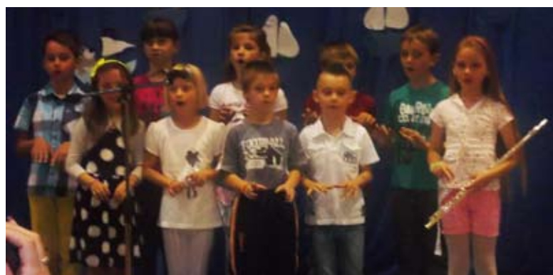
Sladkosned – drugi razred