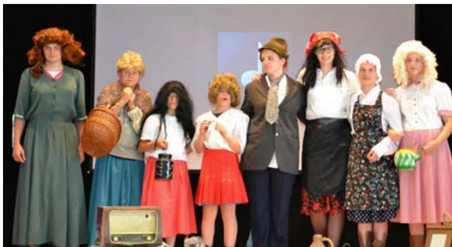
KUD-ovci v akciji

Tudi jesen bo spet pestra in delovna. Načrtujemo, da bomo v Tednu otroka v oktobru na domačem odru za otroke odigrali predstavi Kraljična na zrnju graha ter Volk in sedem kozličkov. V oktobru načrtujemo še literarni večer in kulturno slovesnost ob dnevu reformacije, takrat pa se bomo spomnili tudi stoletnice začetka prve