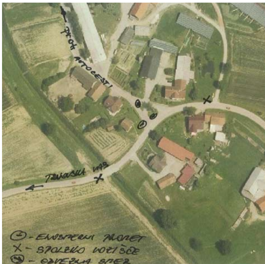
Skica prometne ureditve v križišču