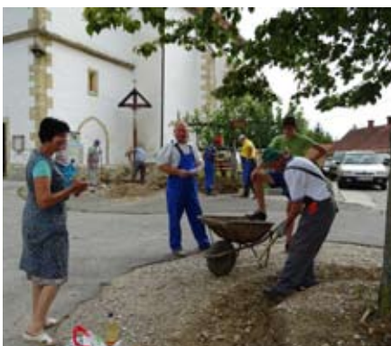
Delovna ekipa pri urejanju okolice cerkve