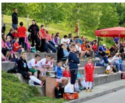
KMN – navijači

Med veterani so bili najprepričljivejši igralci ekipe Prijatelji »Gostilna 29« iz Lenarta pred ekipo ŠD Vitomarci, med dekleti pa simpatične igralke, ki so branile barve ŽNK Cerkevjak.