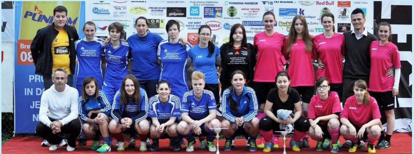
KMN – ženski ekipe Cerkevňjaka in Voličine