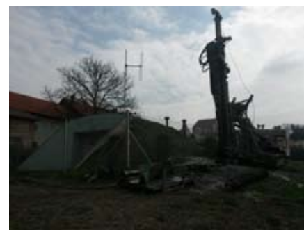
Vrtanje vrtin za vodo

Z namenom zagotovitve kvalitetnejše in cenejše lastne pitne vode v naši občini smo zgradili dve vodni vrtini. Vrtini dajeta skupaj več kot 4 litre vode na sekundo oz. 14.4 kubičnih metrov na uro. V enem letu bi bilo možno načrpati 126.000 kubičnih metrov vode iz obeh vrtin. Letna poraba vode v naši občini povprečno znaša 45.000 kubičnih metrov. Z drugimi besedami lahko rečemo, da bomo imeli trikratno rezervo povprečno porabljene. Pomisleki nekaterih o nevarnosti pomanjkanja vode so torej povsem odveč.