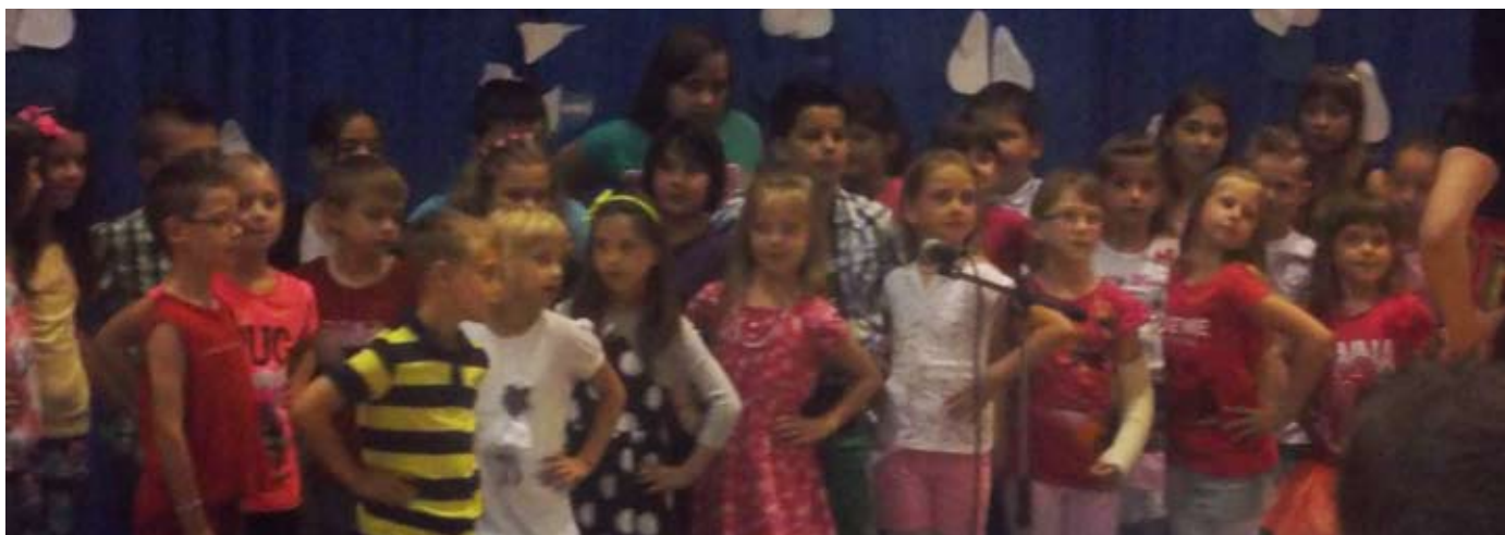
Otroški pevski zbor