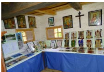
Razstava fotografij v sprednji sobi