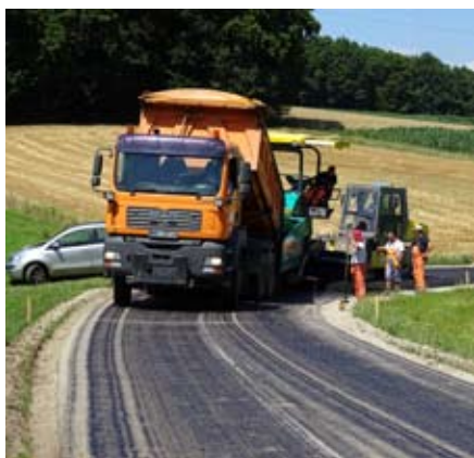
Polaganje prve plasti (grobi asfalt) v Müžah – izravnalna plast

V letošnjem poletju je bilo dokončan projekt Modernizacija cest v Občini Sv. Andraž v okviru razpisa Ministrstva za kmetijstvo in okolje, Ukrepa 322 – obnova in razvoj vasi.