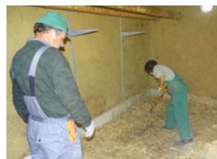
Čiščenje razstavnih prostorov v domačiji

Za delno ureditev notranjosti domačije so pri čiščenju pomagali tudi javni delavci občine. Za začasno ureditev muzejske zbirke smo nabavili material za postavitev peči (apno in opeke), nosilce in deske za police, samostoječe stalaže in drugi drobni material v skupni vrednosti 971 €. Ostala večja dela pa bodo, kot že rečeno, izvedena na osnovi razpisov, ki jih pričakujemo v letih 2015–2016 in na osnovi katerih lahko