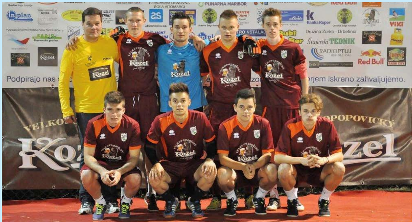
KMN VITOMARCI – domača ekipa v novi opremi dosegla 4. mesto