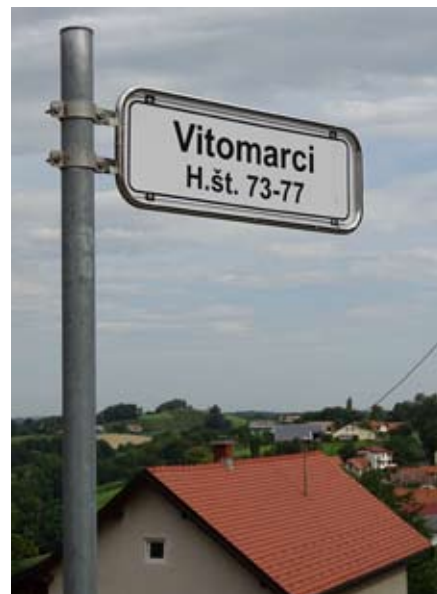
Označevalna tabla – hišne številke