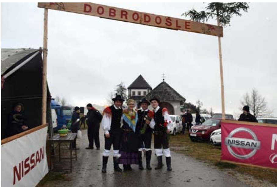
Dobrodošlica na vrhu Limbarske gore