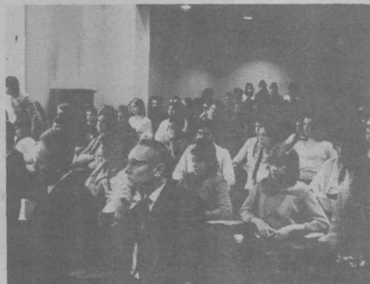
Uspel skok v višino