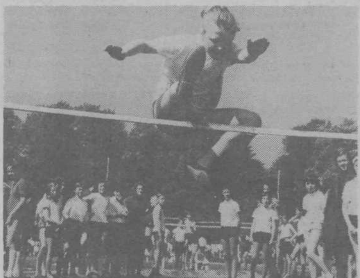
Zastopniki pionirskih odredov iz občine Moste-Polje so na letni konferenci ugotovili, da je bilo delo pionirjev uspešno in koristno, ob tem pa so sklenili, da bodo prihodnje leto še bolj delali.

Posamezniki: 1. Kampjut (Indos) 234 kegljev, 2. Možgon (ELOK I.) 228 kegljev, 3. Vidmar (Jav. sklad.) 221 kegljev.