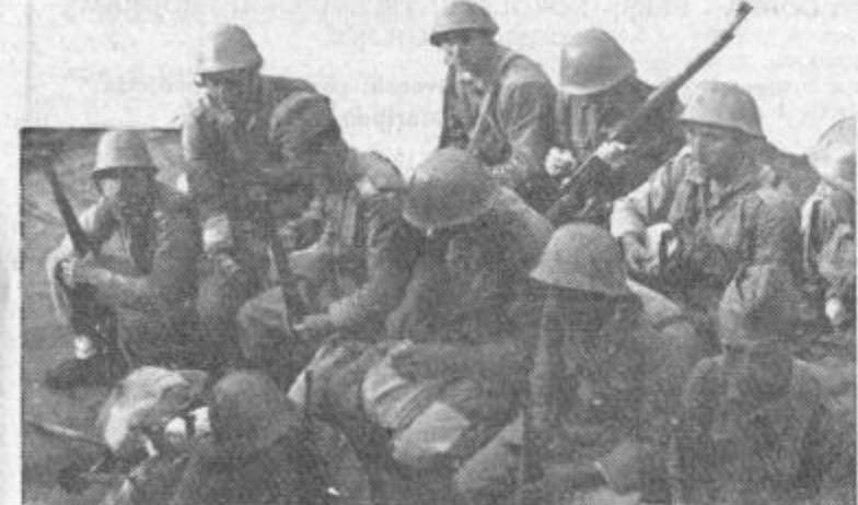
Ko mine ura pouka, sedejo v gruče in pokadijo cigareto, se pogovorijo in uženejo kakšno šalo...

Življenje pripadnikov JLA je podobno življenju v kolektivnih in velikih družinah. Dokler traja služba, učenje vojaških veščin, so delovni kolektiv. Ko pa te ure prenehajo so pripadniki JLA dežni vsa, kar potrebuje mlad človek. Nekateri se posvetijo kulturnemu udejstvanju, drugi športu (slika desno), mnogi gredo v mesto ali počnejo kar jim je najbolj všeč.