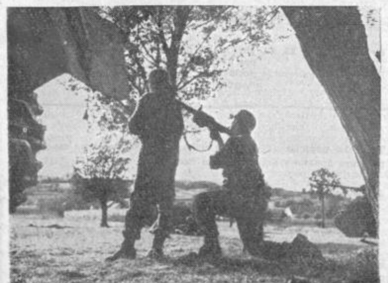
Kadar pa pridejo trenutki preizkušnje osvojenega znanja na vajah in manevrih, takrat gre zares. Kot v vojni... Zato so napovedali v JLA, da bi lahko, če bo treba, uspešno branili domovino.