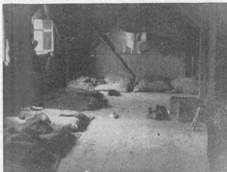
Tako so v nekem našem podjetju stanovali delavci. Nikogar od vodilnih ni bilo sram, da je pri njih tako stanje