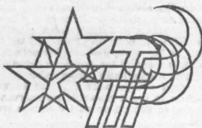
VIII. kongres ZKS

• Kongres je soglasno sprejel tudi predlog sprememb in dopolnitev statuta ZK Slovenije.