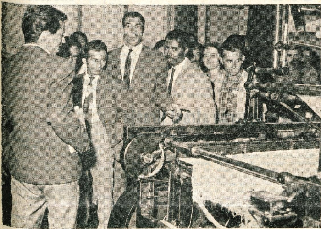
KRANJ, 6. septembra - Včeraj dopoldne je 20-članska mladinska delegacija iz Maroka, ki se te dni mudi na Gorenjskem, obiskala najprej tovarno Sava, za tem pa še tekstilno tovarno Inteks. Gostom iz Maroka je v hotelu Evropa nato tovarna Sava priredila svečano kosilo. Takoj za tem pa so se maroški mladinci odpeljali na Bled, Jesenice in Bohinj, kjer bodo ostali nekaj dni