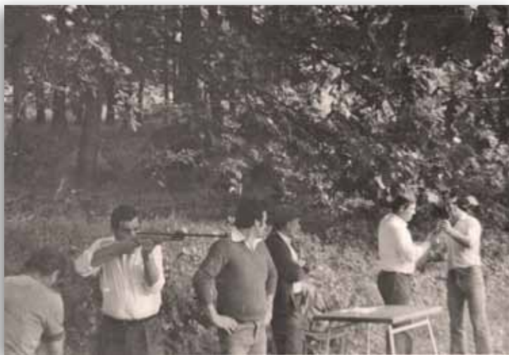
STRELIŠČE LIPA okoli leta 1979