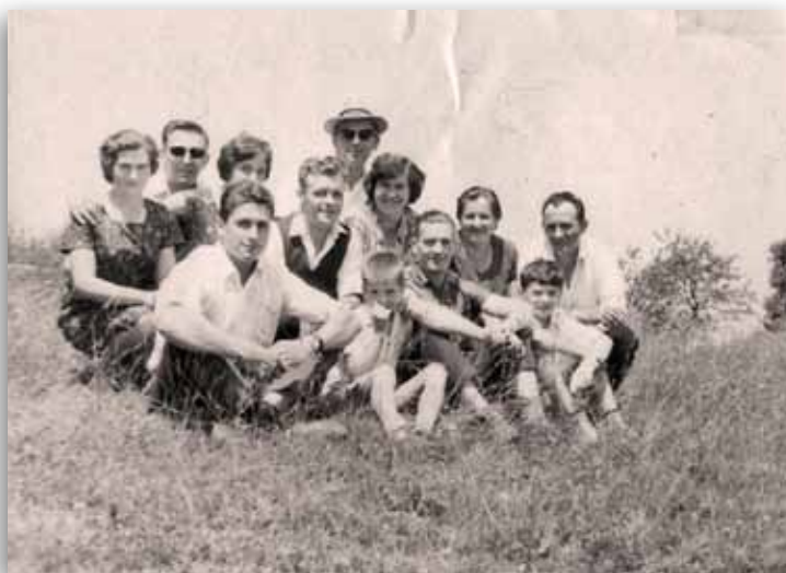
IZLET OBRATA LIVARNA - VALJI, GADOVA PEČ leta 1959