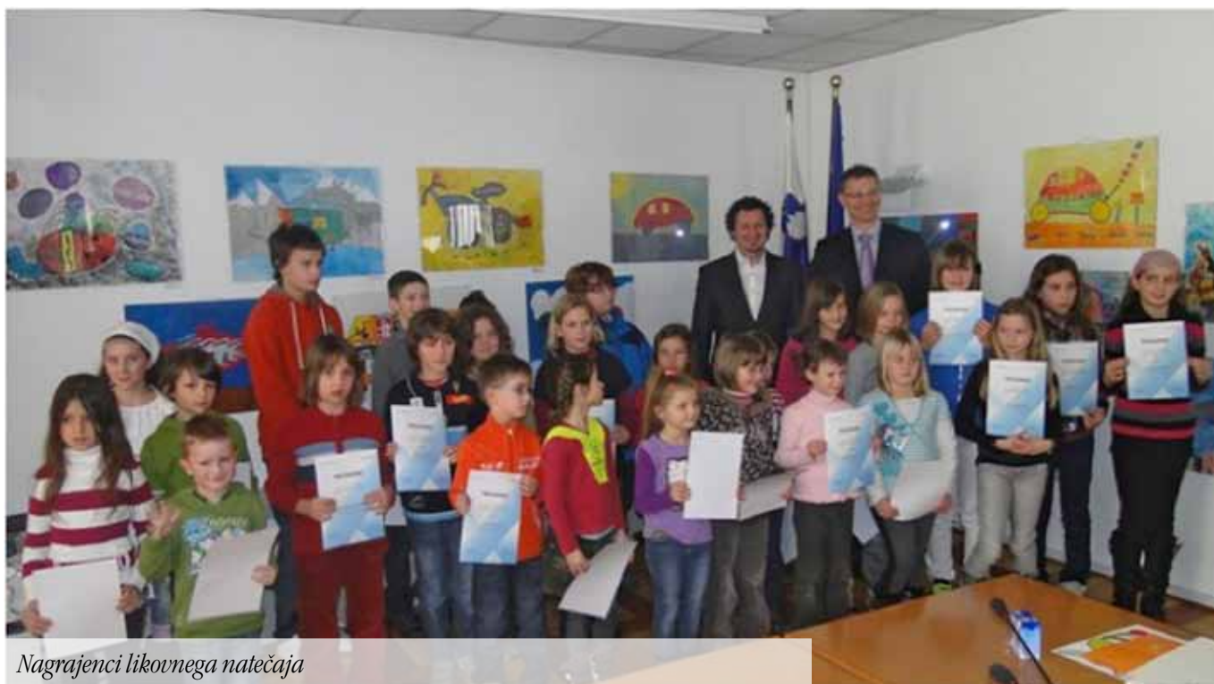
Nagrajenci likovnega natečaja