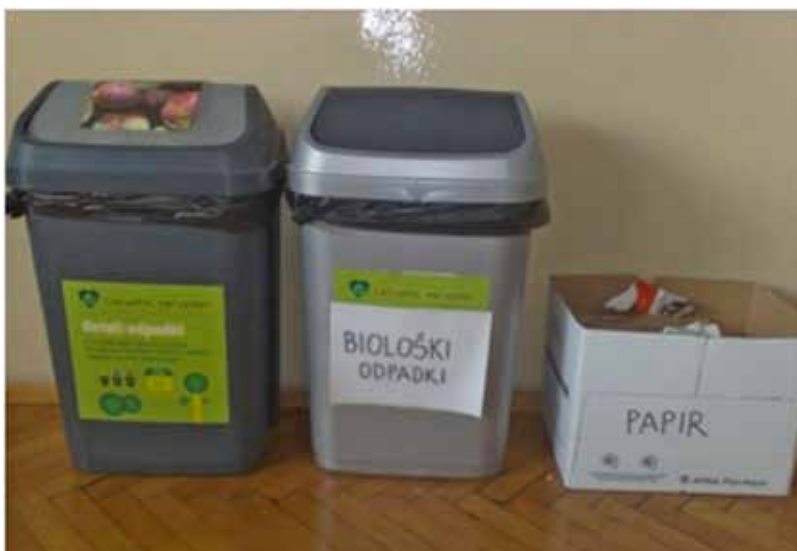
Ločeno zbiranje odpadkov v razredu.

Skrbniki ekološkega otoka na delu; kot vidimo v ozadju, so na žalost tudi smeti ob zabojnikih včasih del našega ekološkega otoka.