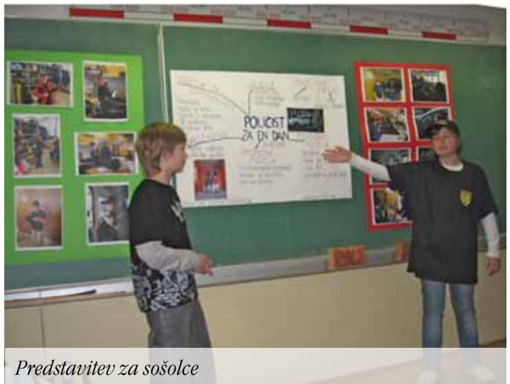
Predstavitve za sošolce

Ta dan je bil čudovit! Z veseljem bi ga ponovil. Veliko smo se naučili in marsikaj smo tudi sami poskusili. Če iskreno povem, si res nikoli nisem mislil, da bom lahko z radarjem meril, kako hitro vozijo vozniki po naših cestah. Za spomin smo dobili tudi majčke »otrok policist« in kape.