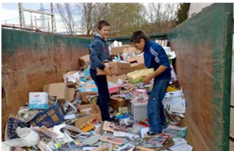
Zbiralna akcija odpadnega papirja je uspela zaradi pridnih učencev - tako tistih, ki so papir prinesli, kot tistih, ki so ga pomagali tehtati in odlagati v kontejner.