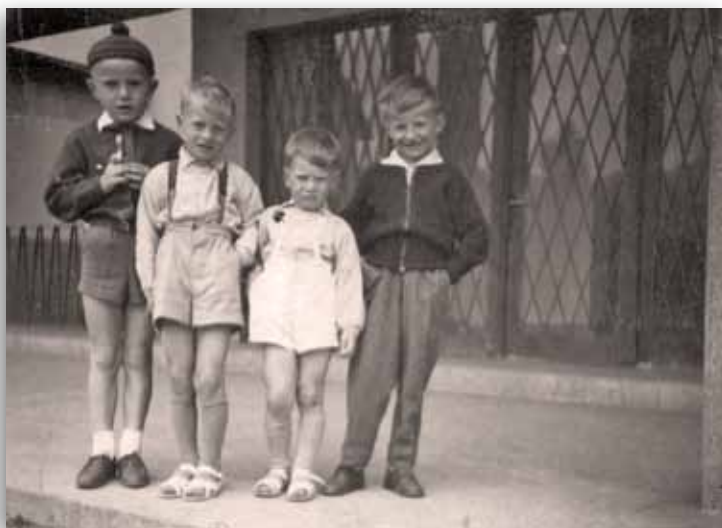
OTROCI PRED KULTURNIM DOMOM okoli leta 1960