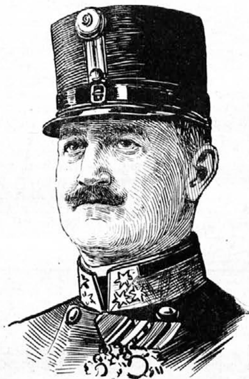
(K avstrijski vohunski zadevi.)

Našo državo je zadela usodepolna nesreča. Eden naših vojaških dostojanstvenikov, generalnoštabni polkovnik Alfred Redl je bil kot vohun razkrinkan. Ko mu je avstrijsko vojno ministrstvo dokazalo, da je kot vohun v ruski službi mnogo tajnih načrtov avstrijske vojaške uprave prodal in izdal Rusiji, se je ta izdajalec v nekem dunajskem hotelu z revolverjem ustrelil. Polkovnik Redl je veljal za enega najnadarjenejših častnikov armade. Prvi sum se je pojavil, ko so v komaj pretekli vojni napetosti opazili,