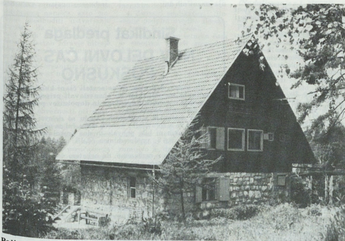
Počitniški dom v Martuljku.