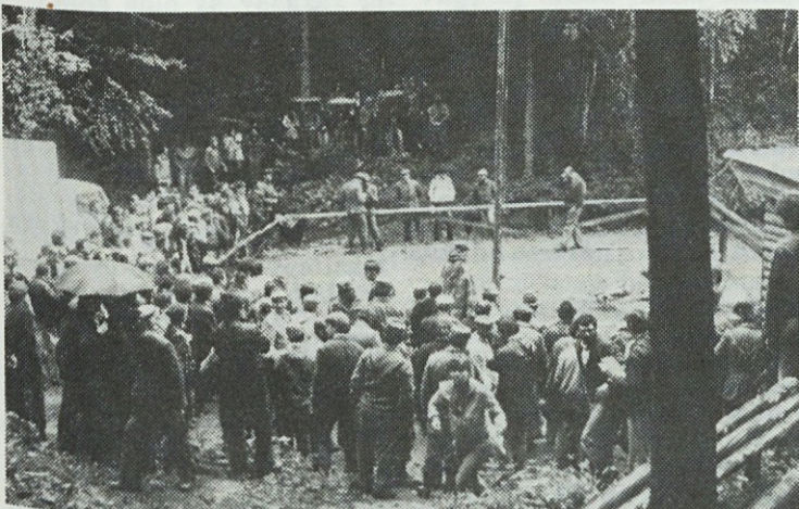
Ob strelišču se je zbralo veliko gledalcev