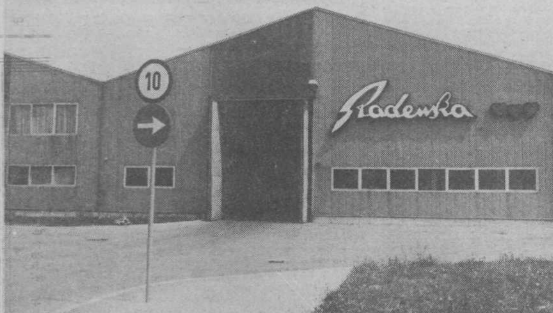
RADENSKA — Tu ima tudi Radenska svoj prodajni center in skladišče za Ljubljano in okolico

Tudi letos so se — že po tradiciji — izmenjali najboljši učenci GIP Gradis in podjetja Bytostav iz Ostrave v ČSSR. V to sodelovanje je letos bilo prvič vključeno enotedensko proizvodno delo. Češki učenci so po opravljenem delu odšli v Gradsov počitniški dom v Ankaran in tam preživeli štirinajstnevnice počitnice. Gradisovi učenci, ki so bili na Češkem, pa so teden dni delali pri adaptaciji počitniškega doma podjetja Bytostav in pri montaži počitniških hišic, štirinast dni pa so preživeli v Malonovicah in od tam obiskovali zgodovinske kraje te prijateljske dežele.