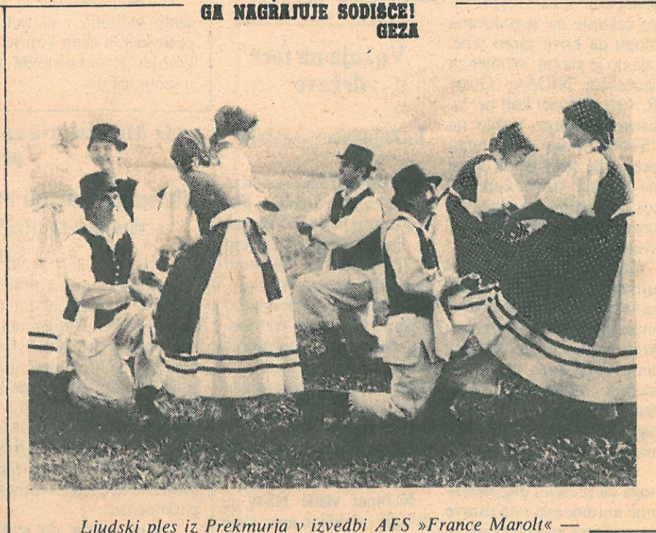
Ljudski ples iz Prekmurja v izvedbi AFS »France Marolt«