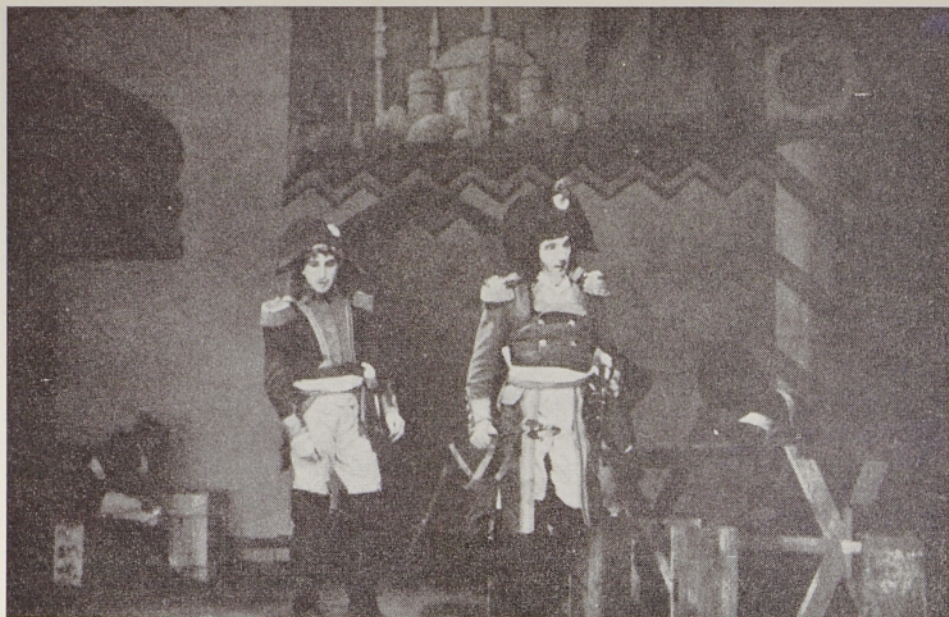
S. Zweig: Siromakovo jagnje, Drama SNG v Ljubljani, 1934/35