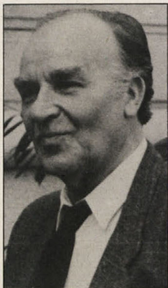
Po ugrabitvi spet na prostosti: Alija Izetbegović.

V teh dneh je fronta črta nedoločljiva. Spopadi potekajo po vsem ozemlju, prav zato ni pričakovati kakršnekoli ustavitve in pomiritve. Doslej zelo slabo organizirani in oboroženi Muslimani se postavljajo „na noge“. Armadi so zaplenili nekaj orožja, očitno pa ga dobivajo tudi po tajnih kanalih od drugod. Krizni štabi in poveljstva