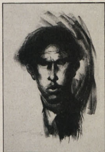
Franjo Golob: avtoportret, litografija, 1936