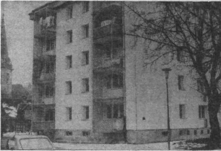
Obnovljena hiša Vožarski pot 10

Ce bi na vaši hiši, bloku all stolpnici začel odpadati omet in bi se pojavile še razpoke po vrhu, bi vas brčkone začelo skrbeti. Obrnili bi se na ustrezne ustanove, organe in morda bi res kdo kmalu prišel pogledat kaj se dogaja, ter uredil, kar bi bilo potrebno. Stanovalci stolpiča na Vožarski poti 10 niso bili te sreče.