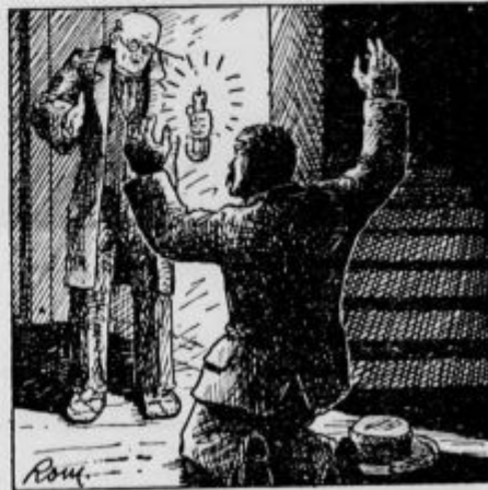
»Jaz sem ubil palirja!«

»Vsa nočoj imejte pamet, pijanci nemarni! Iz teme se je pognal Gregor in treščil v vežo.