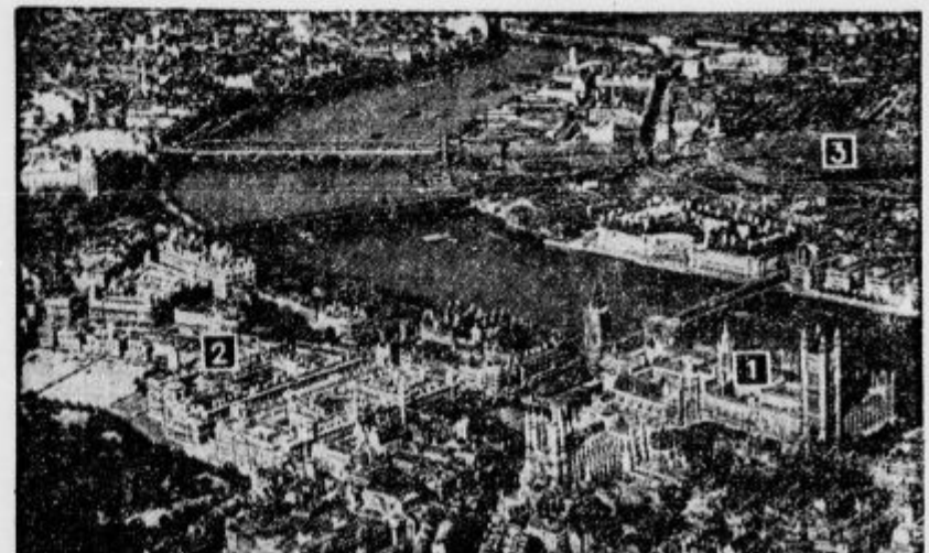
Del Londona iz zraka