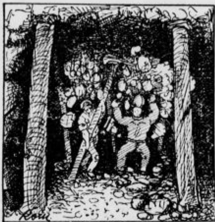
Kakor bi trenil, je zagrmelo o jami.

Pod jamami je palir zarjul: »Fortunati!« Odziva ni bilo. Z orožnikom sta se pognala do jame. Zunaj na kamenju so muhe skrale lužo strajene krvi. Zraven je ležalo krvavo kladivo. »Ubil ga je s kladivom!« Orožnik je pisal zapisnik. »Fortunati! Ubijalec! Vez iz jame!« Strašen molk je trgalo golčanje in škripanje podporinikov, ki je prihajalo iz votline. Starcu so se napele mišice, iz ust se mu je cedila slina, rana na hrbtu se je odprla. Hropel je v divjem obupu. »Tako! ven, v imenu postavke je vele! orožnik. »Nejček, moj Nejček!« je prihajalo iz votline.