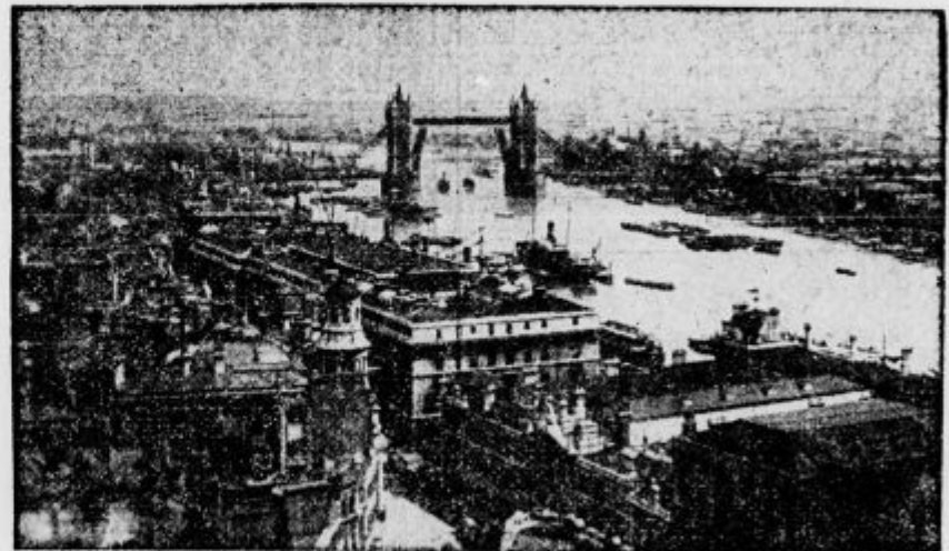
Pristanišče ob reki Temzi