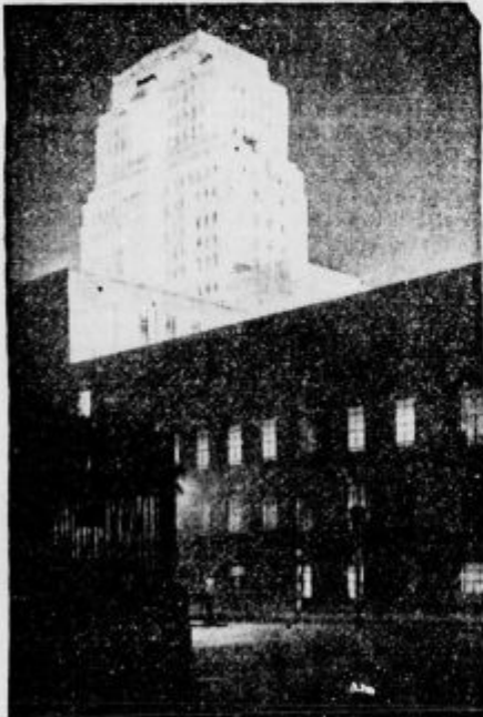
Glavno poslopje londonskega vseučilišča

Po 275 letih pa se spet javlja nasprotnik nad njo samo in ji grozi s porazom.