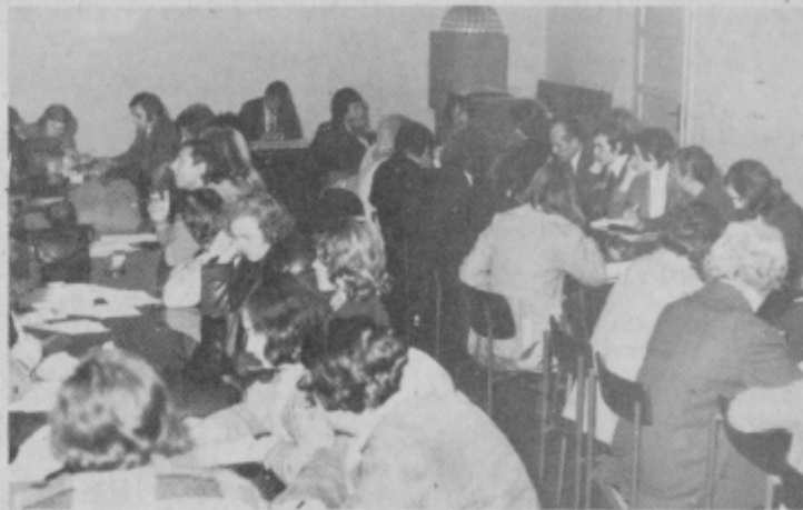
Kljub temu, da se mladi delavci v razpravi niso preveč izkazali, je konferenca sprejela nekaj zelo važnih sklepov.