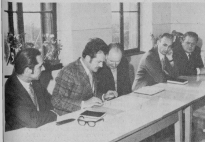
Predstavniki podjetja „Moda“ in občine Ormož ob pregledu plačilnih list in formiranju OD.

Morda pa bodo takšni ukrepi, v kolikor bodo sprejeti, le naredili red na naših vedno bolj krvavih cestah?!