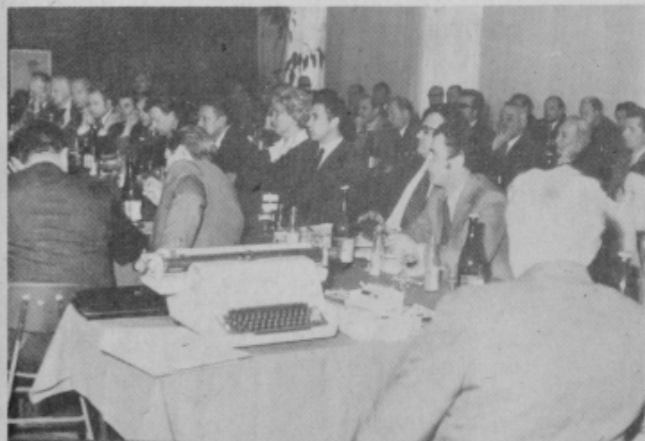
V živahni razpravi so sodelovali zastopniki vseh zainteresiranih republiških in regionalnih služb.

mosta. Z njegovo gradnjo pa bo prizadeta mestna kanalizacija, saj se sedaj steka direktno v Dravo, pozneje pa bo to nemogoče. Tudi za to vbo do strokovnjaki pripravili posebne načrte. Dvig podtalnice pa