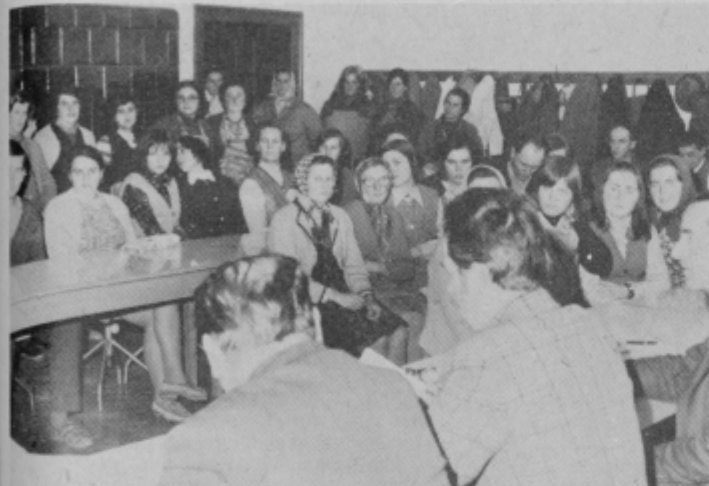
Delavke so zavzeto spregovorile o svojih problemih in skušale analizirati svoje napake.

zato pojavila negotovanja, saj so nekateri zaposleni dobili samo 250 din OD. Prišlo je še do nekaterih izpadov in neresnosti skupinovodje ene izmed izmen, zato je v začetku septembra prišlo do manjše ustavitve dela. Zaposleni so zahtevali spremembo razmer in pojasnila