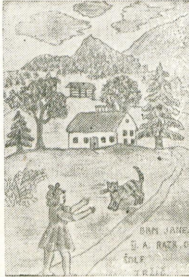
Elišba Janeza Grma, učenca III. a razreda osnovne šole

V prihodnjem šolskem letu se bo stalež učencev na osnovni šoli povečal. Predvideva se 13 oddelkov (vštevši po možnosti razred); tako da bosta na šoli dve vzporednici 1. razreda, po troje