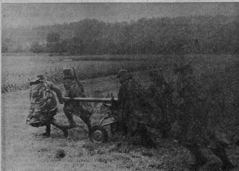
Premik na novi položaj mora biti opravljen kar najhitreje