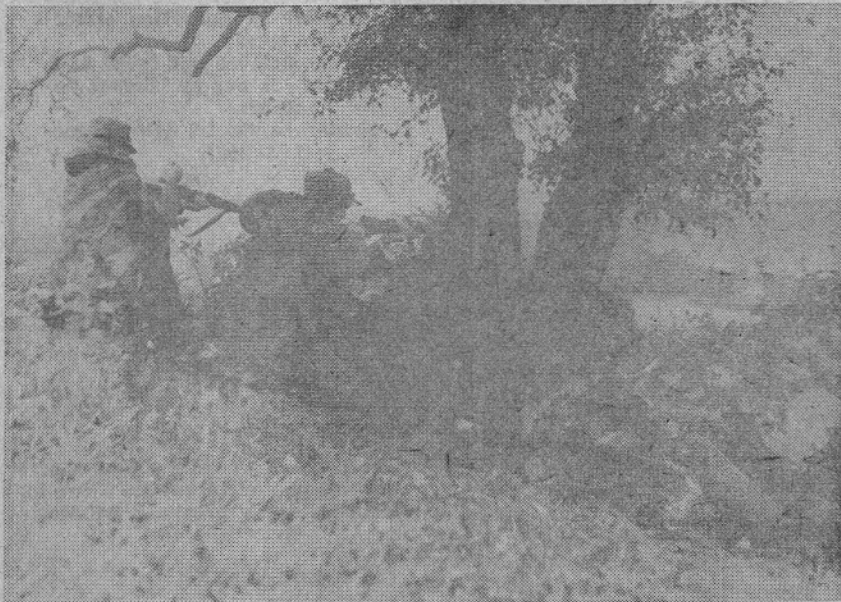
Sovražnika je najbolje pričakati v zasedi

poleg taktičnih vaj posvetili veliko pozornosti tudi idejnopolitični vzgoji, dnevnu informiranju in kljub velikim naporom, h katerim je pristavilo znaten delež tudi slabo vreme, tudi kulturni dejavnosti. Pri vsem tem in zlasti na kulturnem področju so tesno sodelovali s prebivalci krajevnih skupnosti, na področju katerih so se vadili.