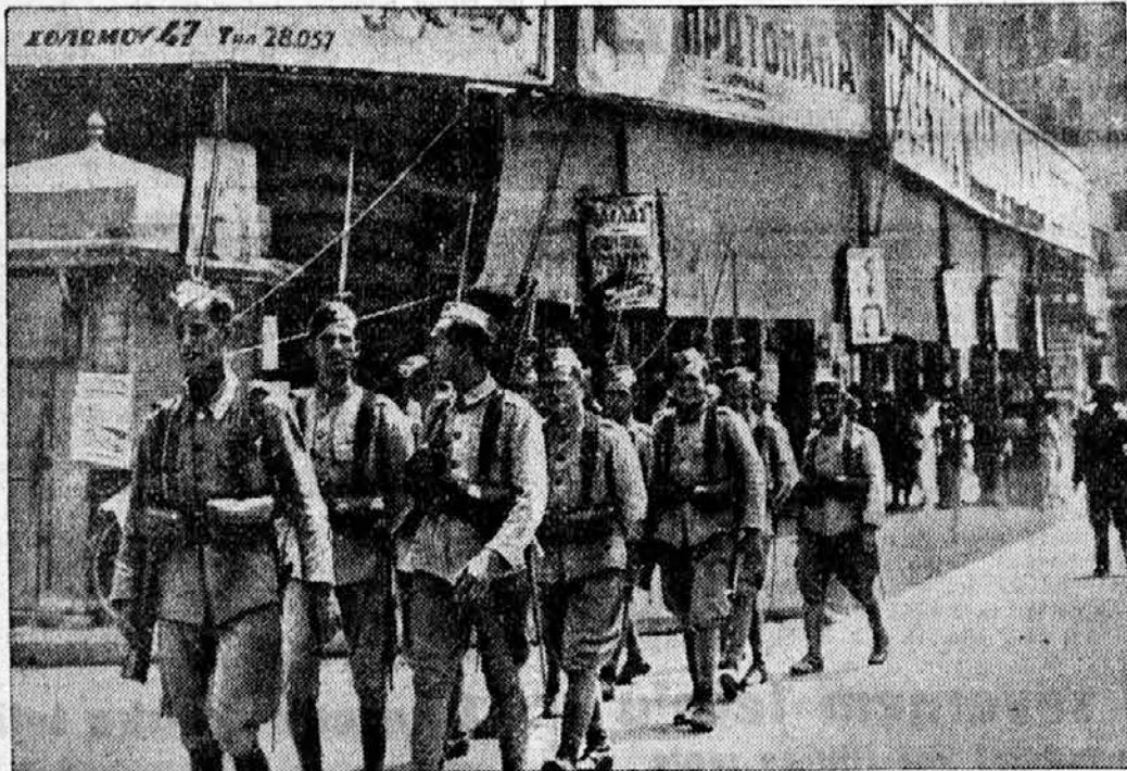
Zaradi varnosti pred komunisti so po atenskih ulicah krožile takele vojaške patrulje. Menda niso imele prav preveč posla.

»O seveda, gospod stražnik. Kateri gospod pa bi se rad peljal?«