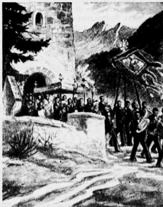
M. Gaspari: Vstajenje