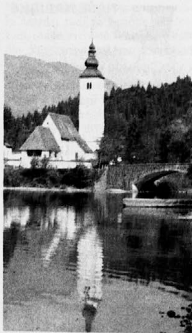
Sv. Janez ob Bohinjskem jezeru