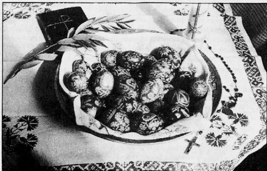
Slovenski velikonočni motív na sliki je dovolj zgovoren, da mu ni treba nobene razlage