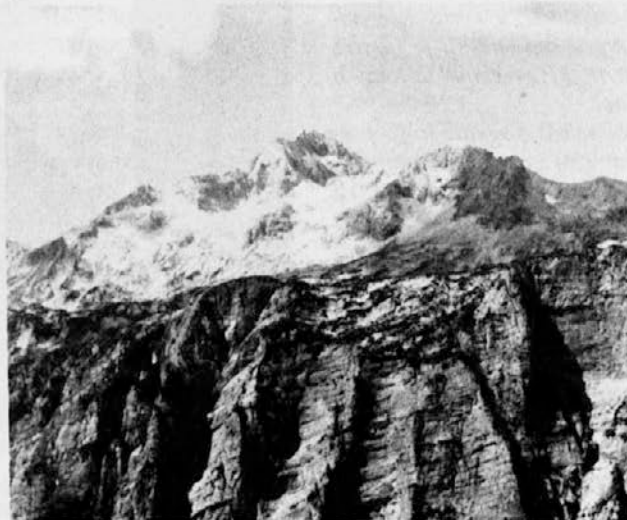
Oj, Triglav, moj dom, kako si krasan! . . .