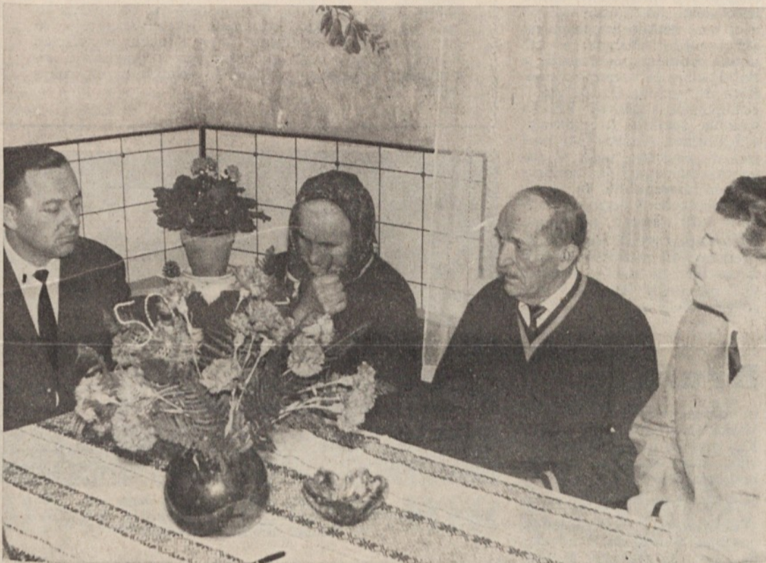
Jubilanta poslušata pozdravni nagovor zastopnika mestnega poročnega urada. Za priči sta jima bila predsednik in tajnik občinske skupščine Moste-Polje