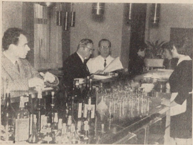
Cene v Krpanu so dokaj »zasoljne« in najbrž to odganja nadležne pijance od njihovega bifeja

Celotna investicija je veljala 1.500.000 din. Od tega je občinska skupščina prispevala 200.000 dinarjev.