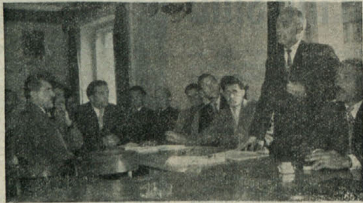
Z zborovanja šoferjev, ki je bilo preteklo nedeljo v hotelu Pugled. Na sliki: predstavniki iz Ljubljane razlaga nekatere nove predpise

Prisotni so razpravljali še o organizacijskih zadevah podružnice Društva šoferjev in avtomobanikov, tovariši iz Kočevske Reke pa so izrazili željo, da ustanovijo svojo podružnico. Me