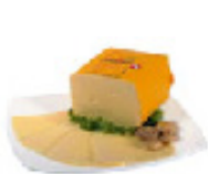
SIR EDAMEC MERCATOR 4,99 EUR/kg