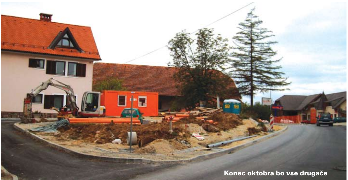
Konec oktobra bo vse drugače