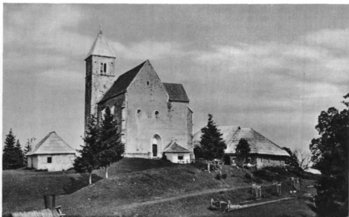
Cerkev sv. Helene na Magdalenski gori (1058 m) nad Gosposveto