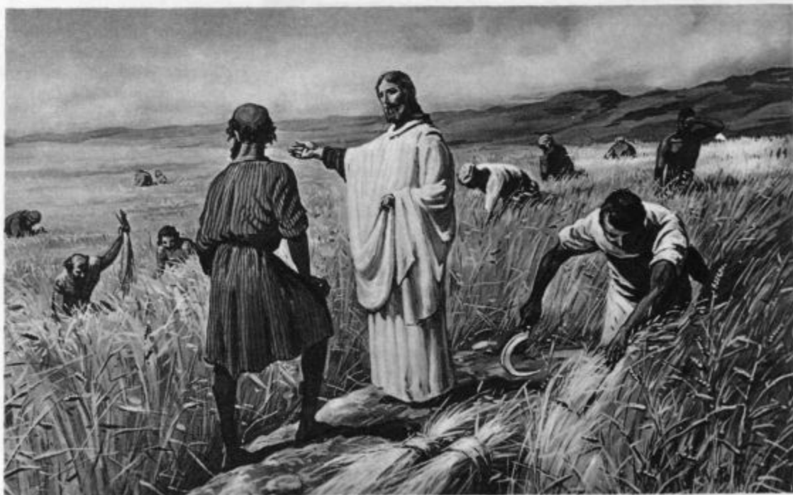
„Žetev je velika, delavcev malo. Prosite torej Gospoda žetve, naj pošlje delavcev na svojo žetev“ (Mt 9, 37)

V župnijski pisarni. »Vzel jo bom, pa je.« — »Ali, ker te poznam in sam veš, kako trda je danes za vsakdanji kruh, ali bosta mogla živeti? Ali ima ona kaj?« — »Jaz nič, ona nič, ampak rada se imava, pa je ,viža ven'.«