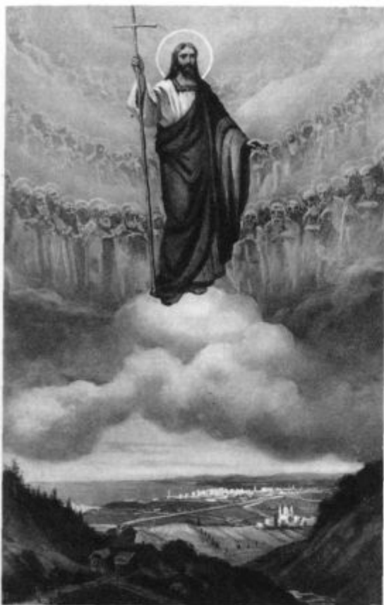
Jezus, Kralj nebes in zemlje

zdaj spomladi ne cvetè samo zato, da lepo cvetè, ampak da prinese sad, ta takega, drug drugačnega. Iz cvetú prave ljubezni, ki mora po božji volji in naredbi vezati oba zakonca, naj prihajajo na zemljo otroci, ki jim Bog po svoji podobi in sličnosti ustvarja umne, nemrljive duše, ki naj se prerodé v otroke božje, živé na zemlji kot otroci božji in dediči nebeškega kraljestva, da postanejo kdaj blaženi posedniki tega kraljestva pri Bogu.