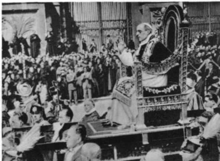
Sveti oče Pij XII. prvokrat kot papež v lateranski stolnici

Pa tudi tam, kjer poroča ženina in nevesto lakomnost, ni sreče in blagoslova