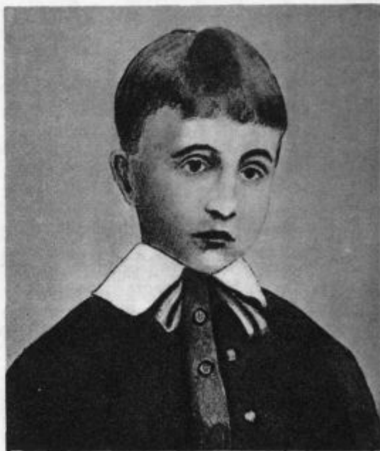
Eugenij Pacelli (sedanji papež) kot 5 letni deček

»Francka, nožiček boš pa rabila. Na, vzemi mojega, za doma mi bo dober popkar,« se je ponudil Tone in ji molil nožiček, ki ga je nekoč kupil na sejmu.