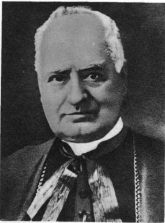
Kardinal Maglione, državni tajnik svetega očeta Pija XII.

se ne bo držal svoje obljube, naj plača pristo- voljno nekaj za kazen v prid domače župnij- ske cerkve, ali naj da določeno vsoto za re- veže. In še ta in druga beseda je padla. Dobre volje torej več ko preveč. Vnelo se je, samo koliko časa bo gorelo. Skoraj je bil dušni pastir prisiljen gorečnost malo gasiti.