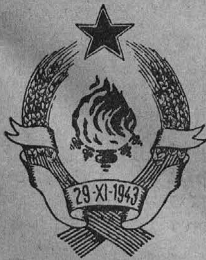
Državni grb Nove Jugoslavije

V zvezi s proslavo našega velikega narodnega praznika 29. Novembra, ko je bil ustanovljen v Bihaću AVNOJ, se je v Buenos Airesu organiziral poseben meddržtevni odbor kateri organizira shod za 2. decembra pod pokroviteljstvom odpravnika poslov jug. poslanstva g. dr. V. Kjuder, na tem shodu bodo govorili predstavniki naše kolonije in tukajšnji česki ambasador gosp. Fr. Kaderabek in eden predstavnik Vseslovenskega odbora.