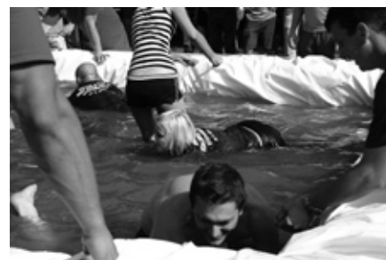
Tekmovalci v akciji

V soboto zjutraj smo uredili še zadnje, saj so se ob 14. uri