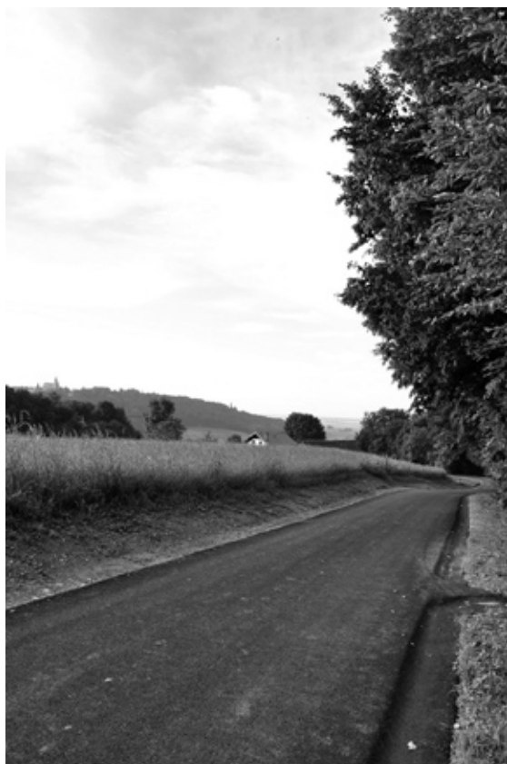
Cesta na Ostragovo

Investicijska vlaganja v občini Sveti Andraž v Slovenskih goricah za obdobje 1999-2002 so skupaj znašala 273.123.052 SIT oz. 1.138.012,00 eurov, kar je štirikrat več, kot je bilo teh sredstev v štiriletnem obdobju krajevne skupnosti od 1995-1998.