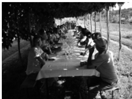
pokušnja na Inštitutu pod brajdami

gotovljeno v Rusiji. Na koncu so nas pogostili s sadjem, žganjem, piškoti in pijačo.