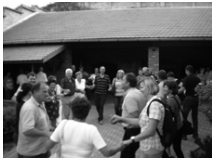
s tamburaši-pleši kolo

Pot smo nadaljevali do Sremskih Karlovcev, namestili smo se v majhen hotel, se osvežili, okrepčali in nadaljevali turistični ogled kraja ob prijetni mladi vodički, ki nas je spremljala oba dneva. Sprehodili smo se do Fontane štirih levov, Magistra, Patrijarskega dvora, Pravoslavnega bogoslužja z univerzo, do karlovške univerze za tuje jezike, katoliške cerkve in drugih kulturnozgodovinskih znamenitosti.