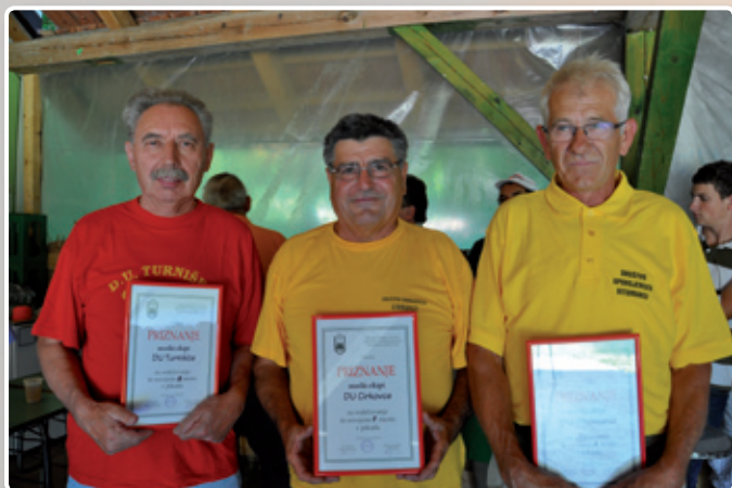
Prve tri ekipe