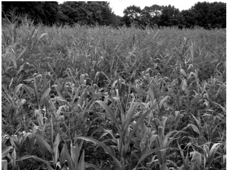
Pelinolistna ambrozija v koruzi

cvetovi so zeleni in majhni (2–4 mm), združeni v podolgovate cvetne glavice (socvetja) na koncu vrhnjih vej. Plod je olesenel, rdeče rjav, 3 do 4 mm velik, se ne odpre, v vsakem je samo eno seme. Semena so kaljiva celo več kot 20 let. Prav zaradi tega se ta rastlina tako hitro širi in nam povzroča toliko težav.