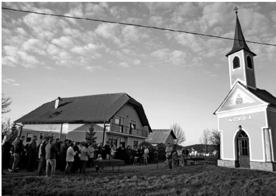
Otvoritev ceste v Hvaletincih

Moje globoko prepričanje je, da so edino investicije pravi pokazatelj uspešnosti posameznih obdobj. Res je, da imamo manjše občine na razpolag manj denarja, res pa je tudi, da pa s tem denarjem razpolagamo sami in denar v celoti ostane pri nas. Dejstvo je, če se denar deli v večjih centrih, pridejo v obrobne predele samo drobtine. V nadaljevanju je ta trditev tudi potrjena.