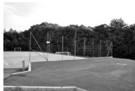
Plato pri igrišču

Morala bi se narediti tudi cesta na »veseli grič«, a je žal ne bo, saj svetniki niso hoteli potrditi zaključnega računa za lansko leto, kar pa je pogoj za