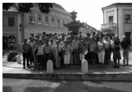
Sremski Karlovci vodnjak štirih levov

Odpravili smo se še na Petrovaradinsko trdnjavo, drugo največjo trdnjavo v Evropi imenovano tudi Gibraltar na Donavi, ki se razprostira na 120 hektarjih površine. Prvotni namen trdnjave je bila zaščita pred Turki, vendar ni nikdar služila temu namenu, bila je požgana, obnoviti pa jo je dalo avstrijsko cesarstvo.