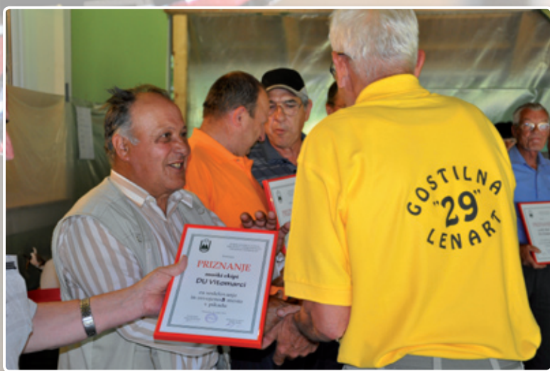
Naša ekipa je osvojila 3. mesto