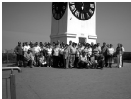
pod uro na Petrovaradinu

smith in pink lady, vse sadike izvrstne kakovosti (6+ in več). v celoti sta postavljena armatura in kapljični namakalni sistem, dokončujejo še samo postavitve mreže, kar bo opravljeno te dni. Drugo leto bodo zagotovili tudi oroševalni sistem proti mrazu. Strokovno in materialno sodelujejo z Italijani, tržišče za prodajo jabolk pa naj bi imeli za-