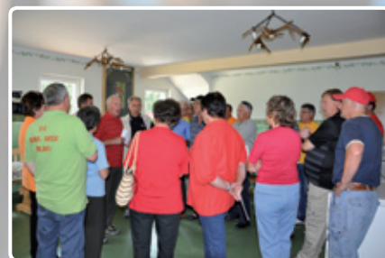
Udeleženci so pozorno poslušali navodila