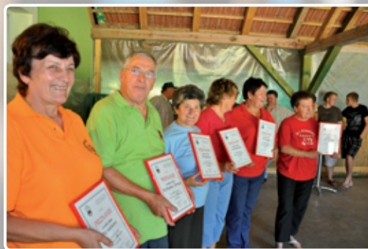
Ženske ekipe so se odlično odrezale