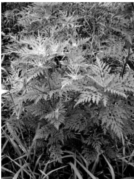
Pelinolistna ambrozija na neobdelanem zemljišču

2 metra in običajno precej razvejana. Če raste na prostem, je nekoliko nižja in bolj razvejana, v posevku pa lahko koruzo povsem preraste. Listi so sestavljeni in nazobčani, kot pri praproti, dolgi pa so 4 do 10 cm. Na obeh straneh so svetlo zeleni z vidnimi žilami. Celotna rastlina je prekrita z dlačicami. Cveti od konca julija do konca septembra oz. do prve slane, odvisno od vremenskih razmer, vlogo opraševalca opravi veter. Ena rastlina lahko ustvari nekaj milijonov pelodnih zrn, po nekaterih podatkih celo milijard. Pelodna zrna imajo zelo dobre aerodinamične lastnosti, saj lahko z vetrom prepotujejo razdalje tudi večje od 100 km. Na eni rastlini so ločeni ženski in moški cvetovi. Ženski cvetovi so neopazni, posamični ali v manjših skupinah v zalistju zgornjih listov. Moški