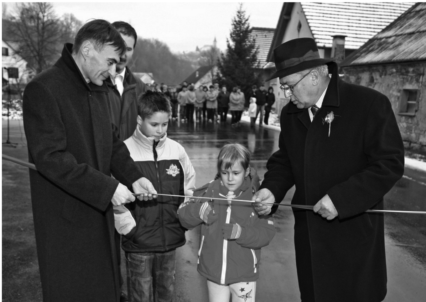
Otvoritev ceste v Drbetincih

OBČINA DESTERNIK – TRNOVSKA VAS (Krajevna skupnost Sveti