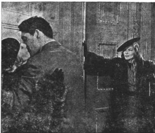
Prizor iz filma »Flirt«, Kino »Union«.

Delo drame: Od dramskih del omenjamo v prvi vrsti domača dela. Velik uspeh je doživelo lepo Cajnkarkjevo dramsko delo »Potopljeni svet«. Druga domača dela so bila: Cankarjevi »Hlapci«, Finžgarjeva »Veriga«, Goljeva »Dobrudža 1916« in štandekerjeva »Prevara«. Slovenska dela so bila zaporedno na vrsti ob jubileju našega Narodnega gledališča. Od vseh ostalih slovanskih del so bila vprizorjena: »Tolstojev car Fjodore« in »Živi mrtvec« (ob 25-letnem igralškem jubileju Emila Kralja), dve deli češkega dramatika Piskoča: »Upniki — na plan« in »Velika izkušnja« ter Poljaka Niewierowicza »Hollywood«. Dela iz stare klasične dramske književnosti so bila: Moliérov »Izsiljena ženitev« in »Ljubezen zdravnik« ter Shakespearejev »Othello«. Ostali avtorji so bili: Strindberg: »Labodka«, Vuolijoki: »Žene na Niskavnoriju« — eno izmed najbolj zanimivih in največkrat igranih dramskih del v pretekli sezoni — Priestley: »Brezov gaj«, Benedetti: »Trideset sekund ljubezni«, Pirandello: »Kaj je resnica?«,