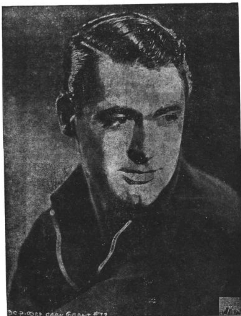
Cary Grant v filmu »Flirt«.

Odslej je bil Haydn navezan popolnoma na samega sebe. Sodeloval je pri zborih in orkestrih, kjer je dobival le skromne honorarje. Tedaj so imeli lepo navado, delati podoknice s celimi orkestri in kdo bi danes verjel, da so nočni čuvaji, predhodniki policije, držali godbenikom pri podoknicah sveče! Naši navivni predniki pač še niso smatrali godbe za kaljenje nočnega miru. In tako se je pač namerilo, da je prva ohranjena Haydnova skladba bila taka serenada. Marsikak menuet je postal popolnoma naroden in so ga popevali po gostilnah.