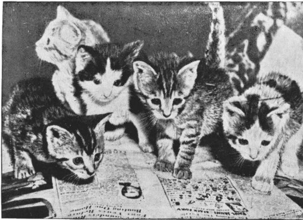
Kako so radovedne