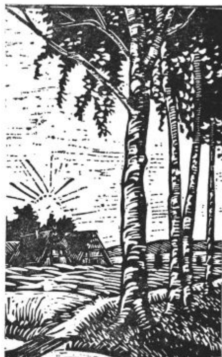
Breze ob poti...

go pridobil tudi na poznavanju glasu. Ob tem času — Haydn je postal devetnajstleten — je dobil naročilo za komično opero »Krivonogi vrag« proti plačilu štiriindvajsetih cekinov. Tekom treh let je bil Haydn klavirski spremljevalec domačih koncertov, ki jih je priredil princ Hildburghausen. V tej hiši se je seznanil z Gluckom in večino dunajskih glasbenikov. Baron Fürnberg je naročil od trindvajsetletnega Haydna skladbo za svoje muzikalne pojedine, ki jih je dajal v letnem gradiču blizu Dunaja. Tedaj je pisal Haydn svoj prvi kvartet, s katerim je rastel njegov ugled med dunajsko aristokracijo, tako da je mirne duše pomaknil ceno glasbenih lekcij od dveh na pet goldinarjev mesečno. Tu nastopi na svetovni pozornici proslavljeni, češčeni Haydn, ki ga vsi poznate in o katerem pisati je že odveč. In ko boste poslušali njegove kvartete opus 20 in 33, se spomnite nekoliko tudi na neslavnega človeka, ki je pisal svoj prvi kvartet, da ga je fina gospoda poslušala, med tem ko je obirala piščance in pila vino.